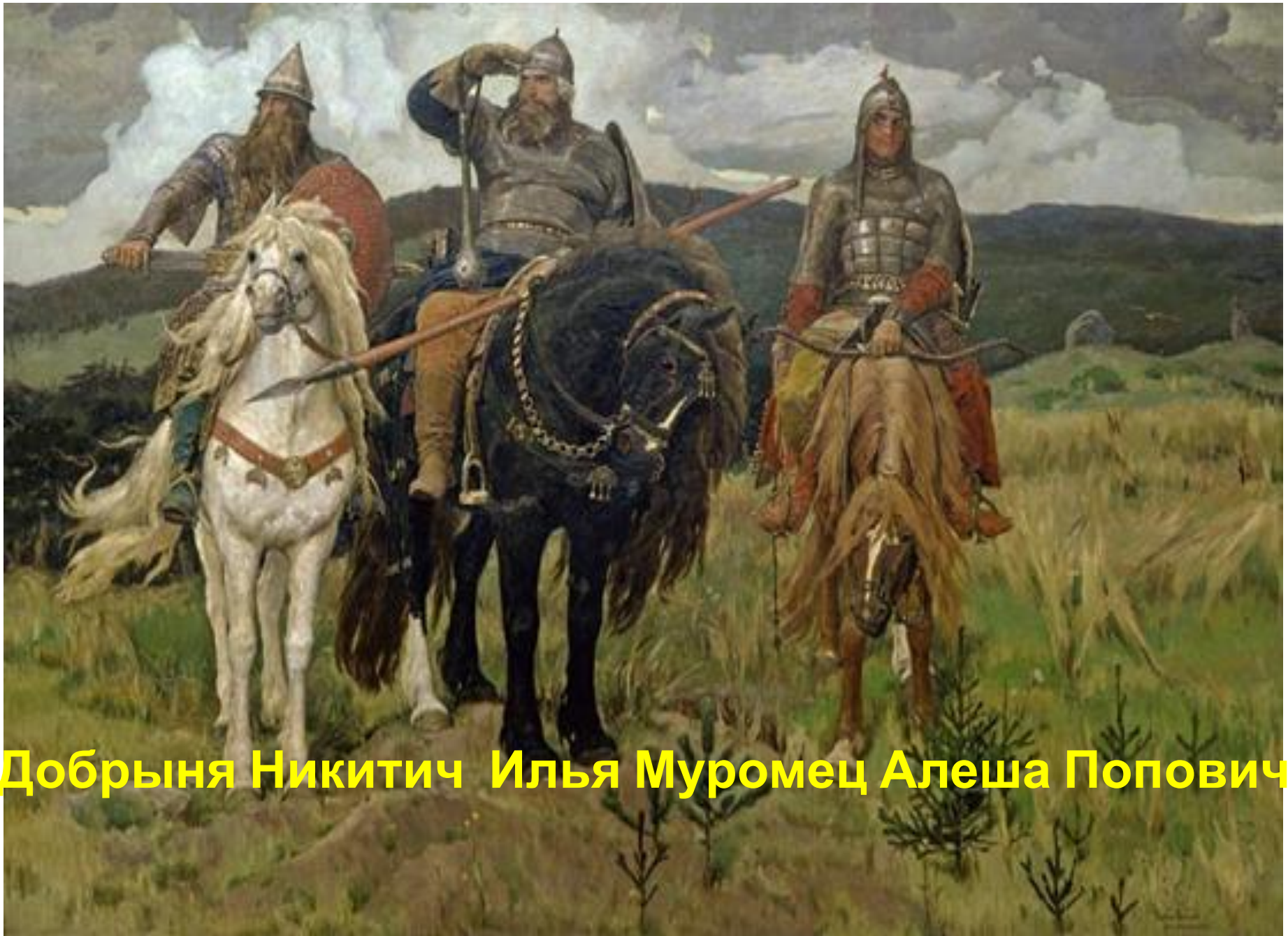
Добрыня Никитич Илья Муромец Алеша Попович