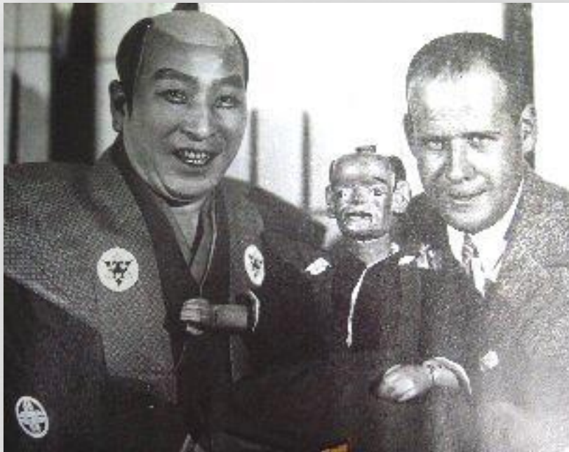
Ітікава Садандзі ІІ і Сергій Ейзенштейн (1928р.)

Перші закордонні гастролі кабукі пройшли в 1928 році в Радянському Союзі. Труппу , що включила 19 акторів , 8 музикантів та 8 чоловік допоміжного персоналу , очолив Ітікава Садандзі ІІ. Колектив привіз із собою три програми; вистави пройшли в Москві і Ленінграді і мали у радянських глядачів великий успіх. Учасники гастролей мали можливість познайомитися з виставами московських театрів і спілкувалися з радянськими театральними діячами.