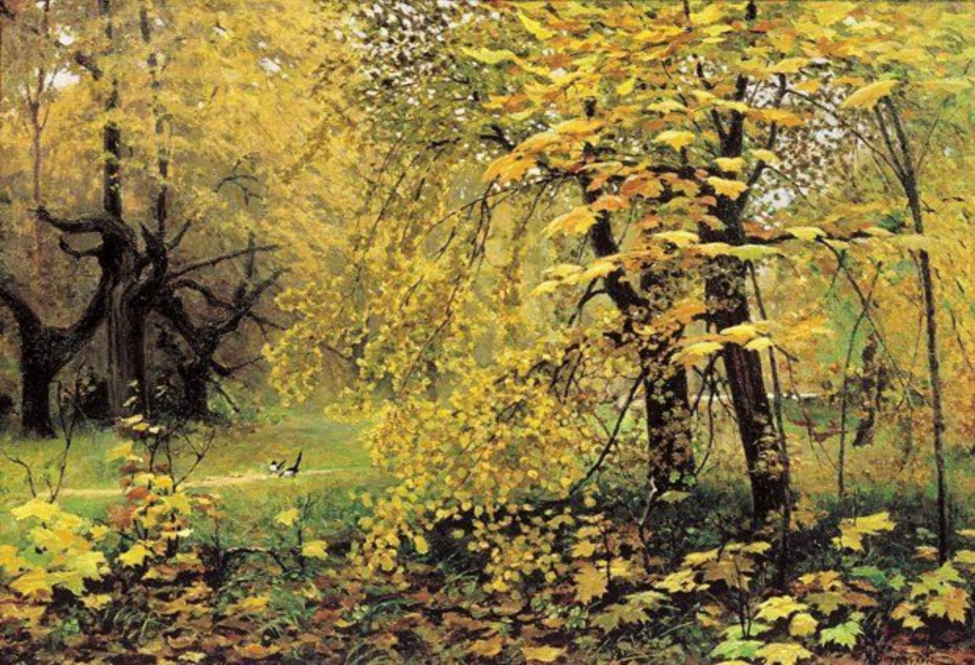
И. С. Остроухов Золотая осень. 1886