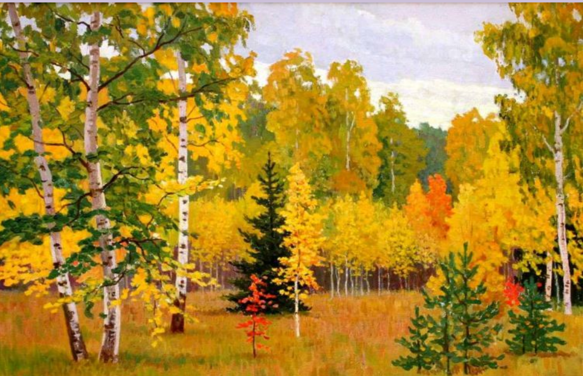
Е. Золотов. Одноименная