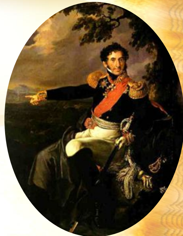
Багратион П. Р.