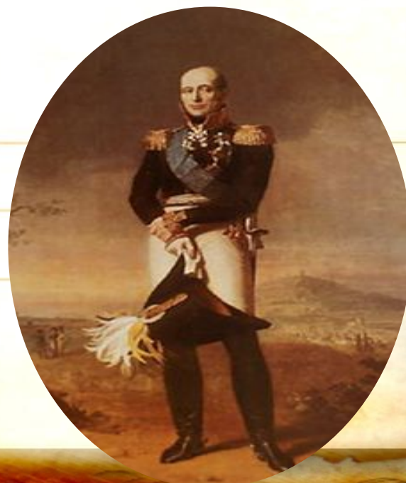
Барклай -де -Толли