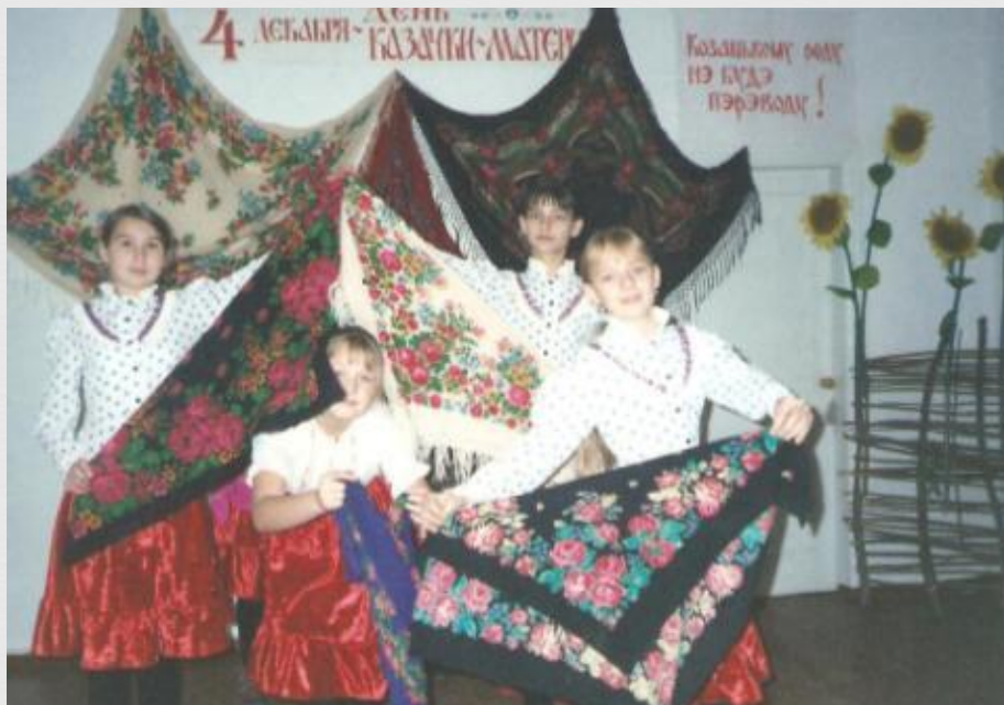
□ День Матери казачки