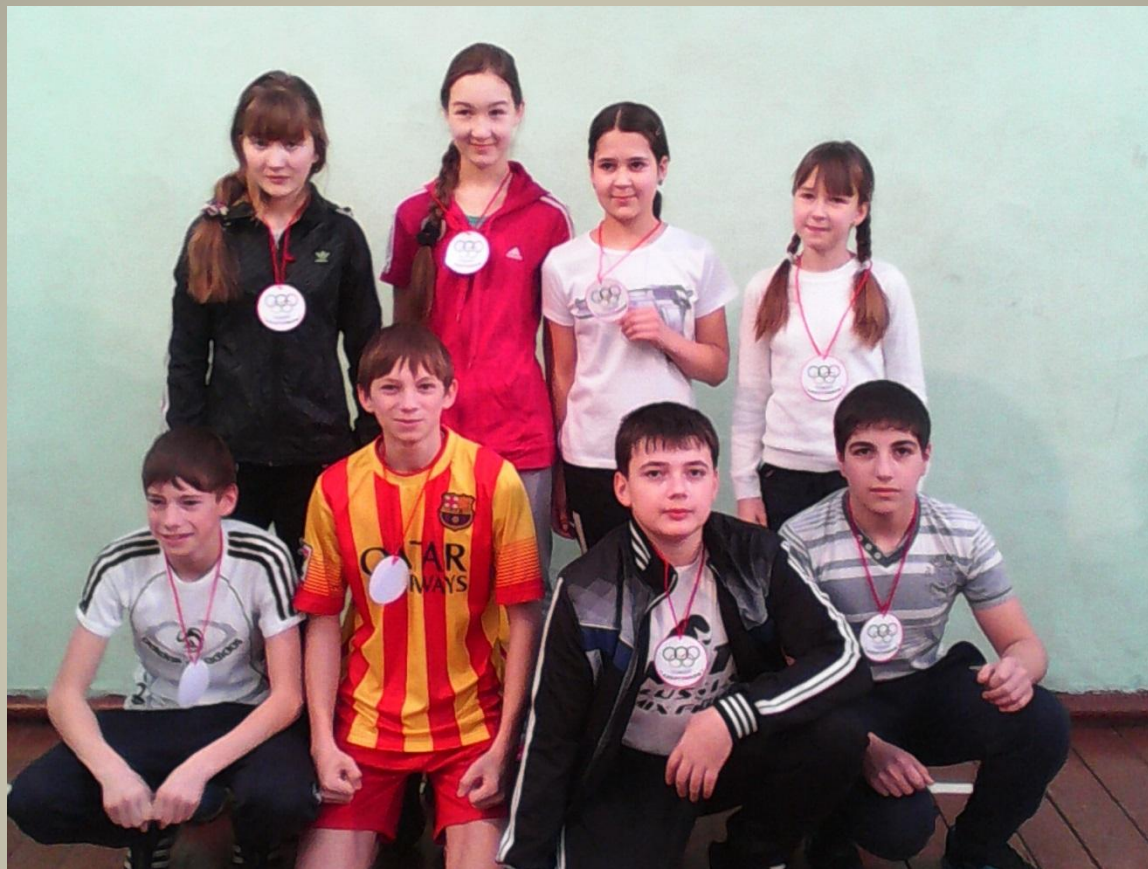
Самым талантливым олимпийцам