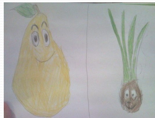
Работы учеников 1-го класса.