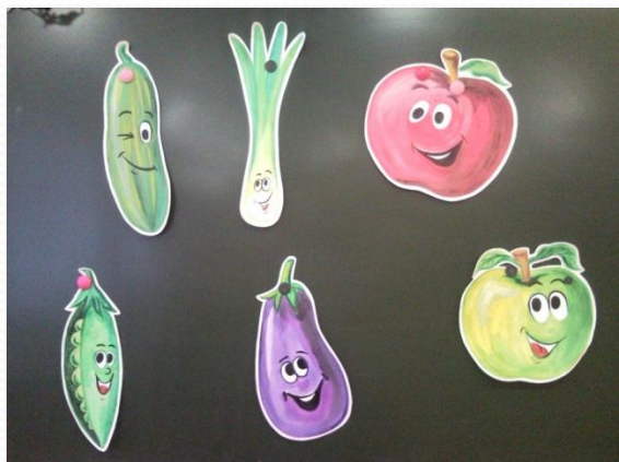
Примеры на классной доске.

На занятии ученики изображали полезные продукты питания.