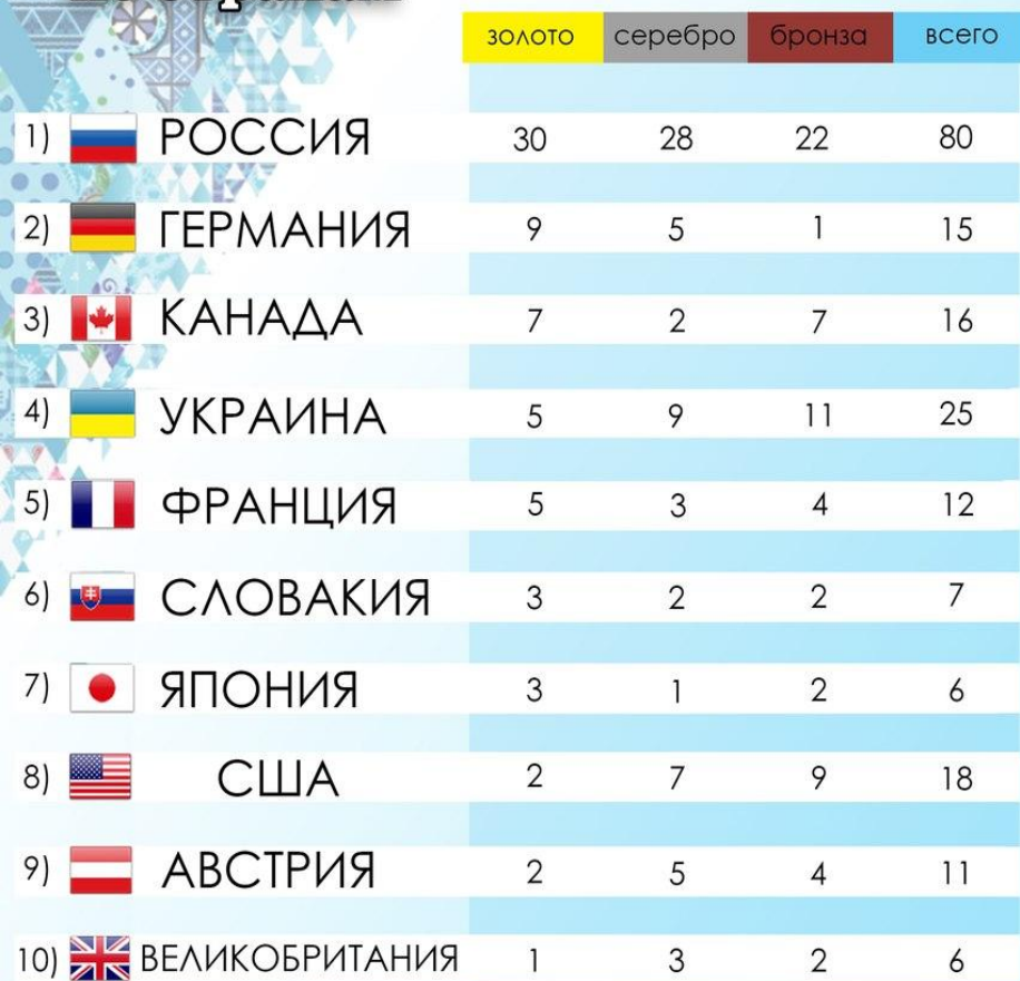
Таблица медалей Паралимпийских игр по странам