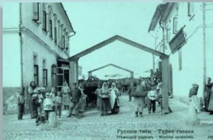
Русские типы - Types russes Итальянский рынок - Marché italien.