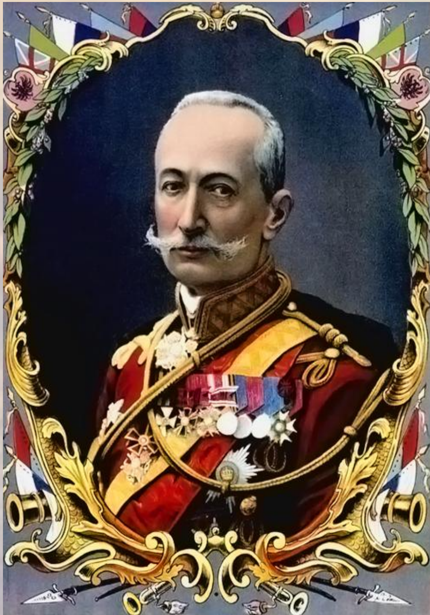
Литография. Типография М.Д. Сытина. Москва, 1916 г.

Генеральское прошлое послужило причиной ареста Брусилова органами ЧК в августе 1918 г. Благодаря ходатайству сослуживцев генерала, уже служивших в Красной Армии, Брусилов был вскоре освобожден, но до декабря 1918 г. находился под домашним арестом. В это время его сын, бывший офицер-кавалерист, был призван в ряды РККА. Честно сражавшийся на фронтах Гражданской войны, он в 1919 г. во время наступления войск генерала Деникина на Москву попал в плен и был повешен.