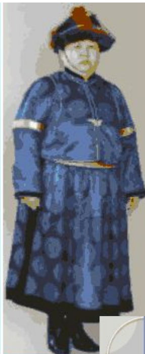
(Пример шёлков халата)