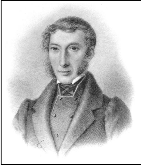
С. П. Трубецкой «диктатор» восстания