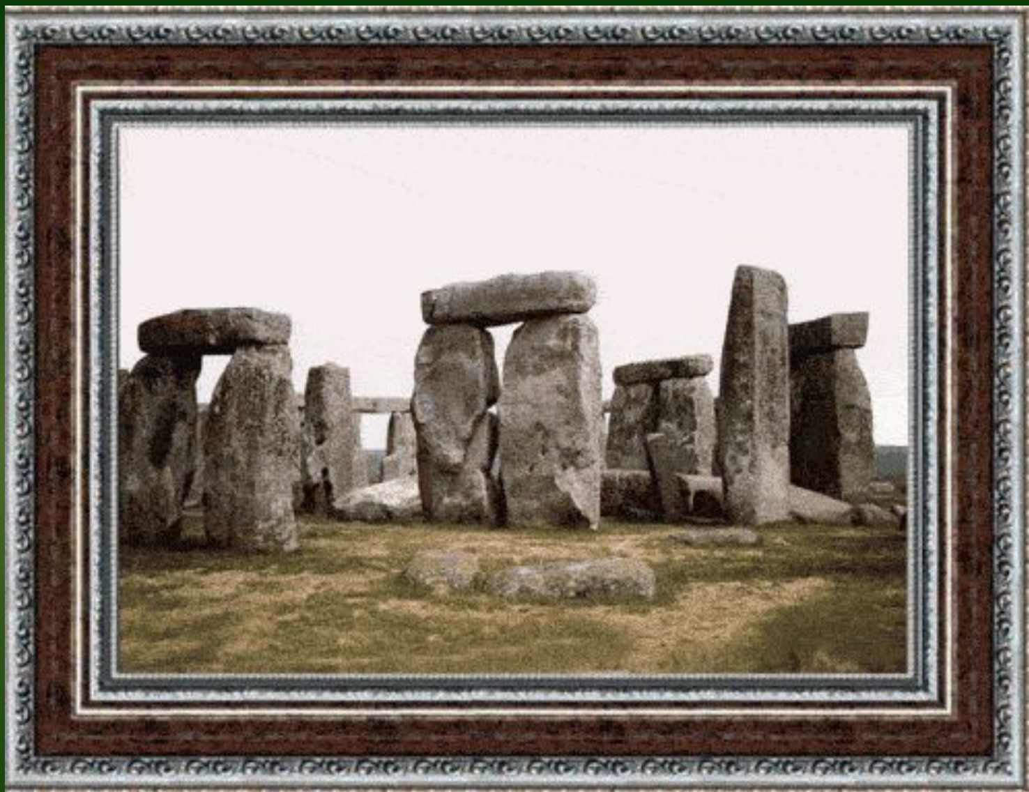
Стоунхендж. Великобритания. Ок. 2000 до н. э.