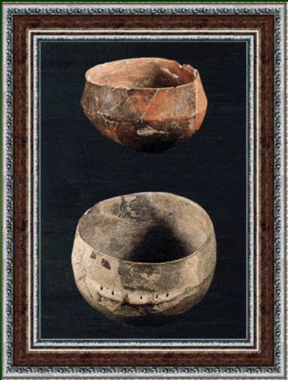
Две миски. Из пещеры Льва в Аньяно. Терракота.