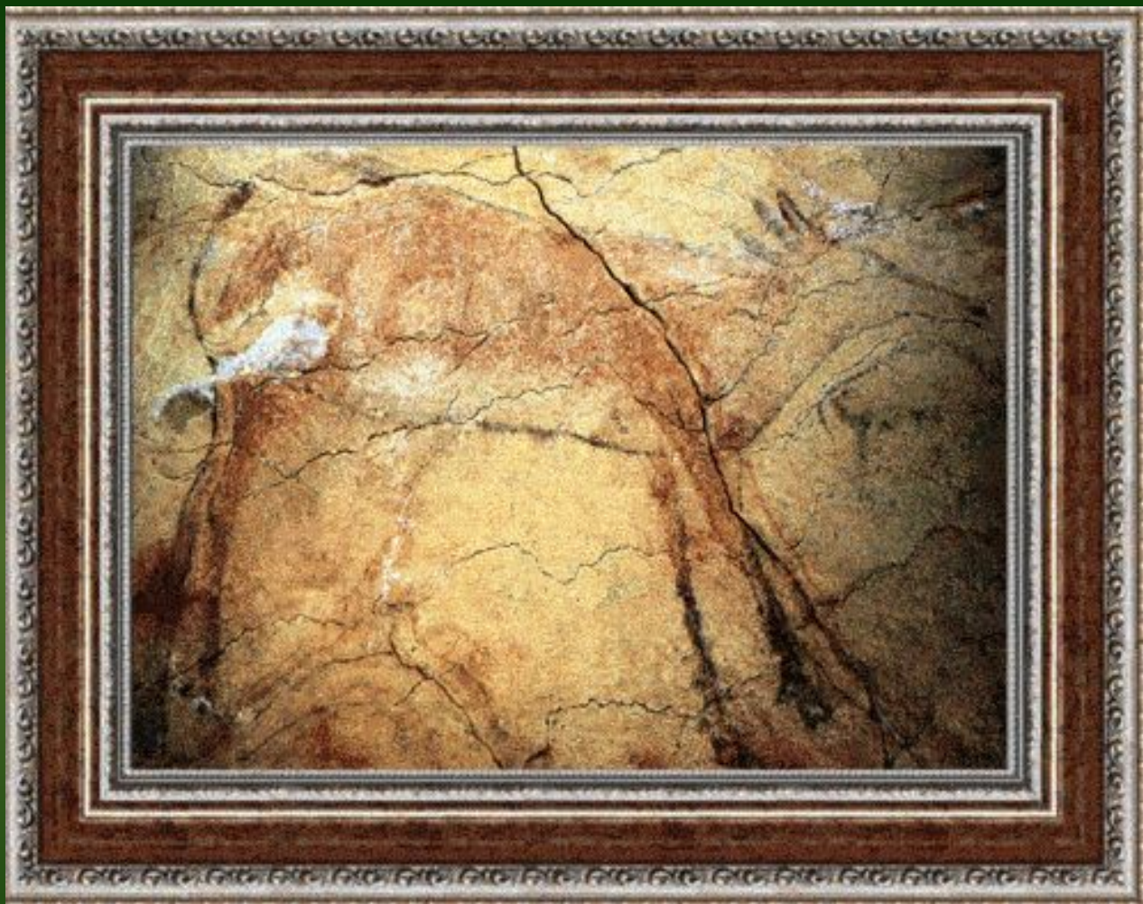
Олень. Пещера Альтамира. Сангандер, Испания. Наскальная живопись. Ок. 12 000 до н. э.