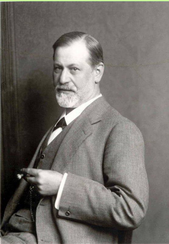
З. Фрейд (1856 – 1939).