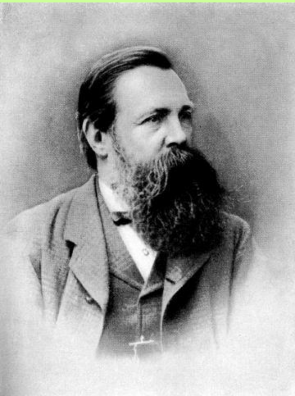
«Человека создал труд» (Ф. Энгельс)