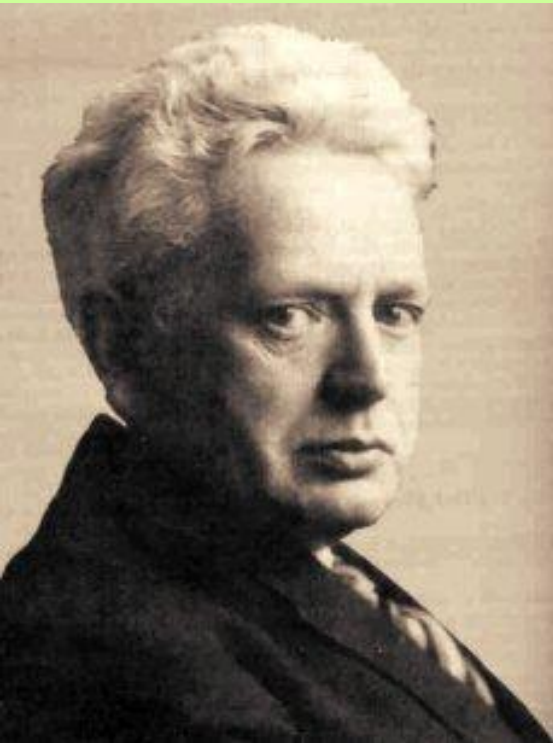
Эрнст Кассирер (1874 – 1945)