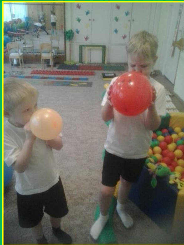
Упражнения на развитие дыхания