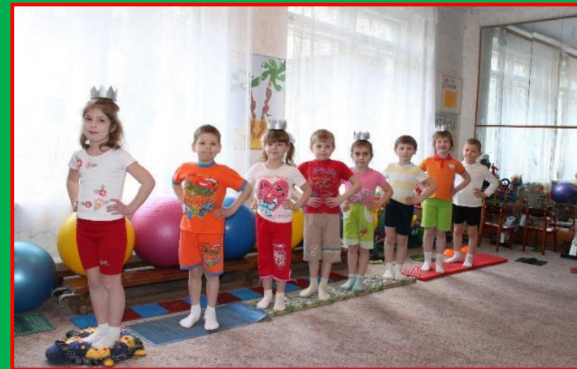
Ходьба по коррекционным дорожкам