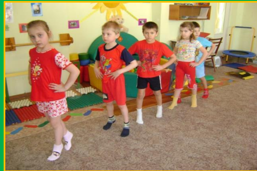
Разные виды ходьбы