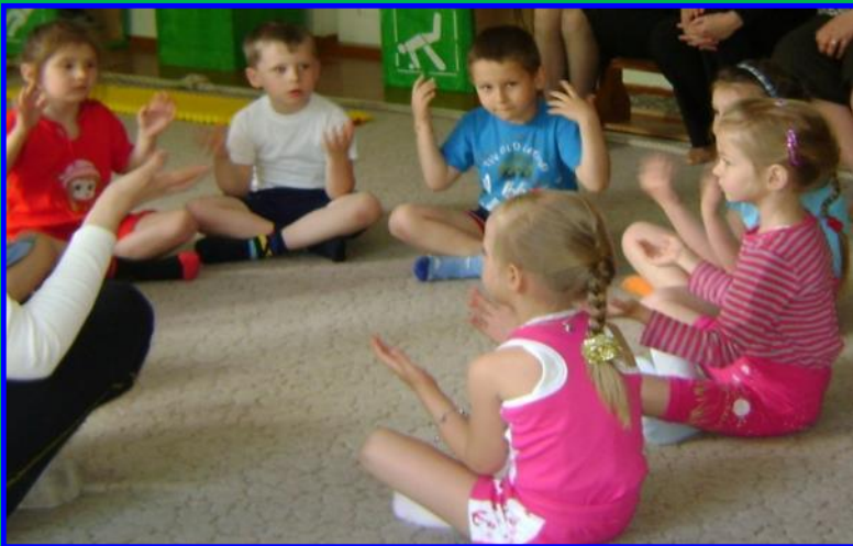
Упражнения на релаксацию