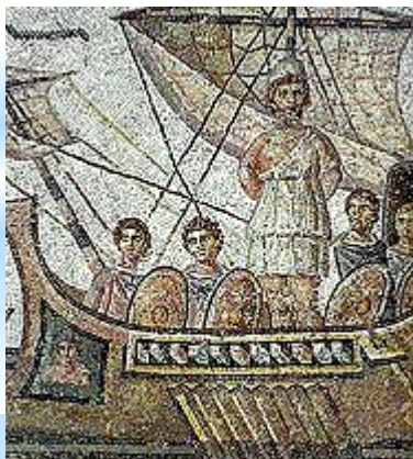
« Одиссея » Древняя Греция