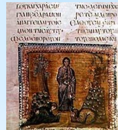
Евангелие Россия, IX в.