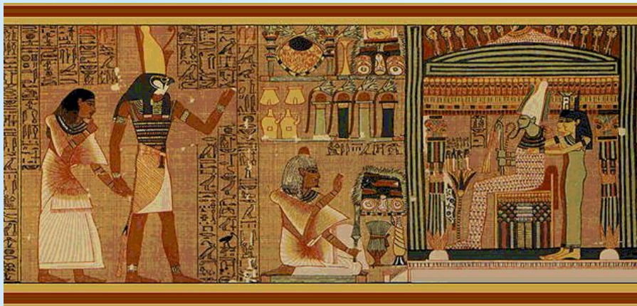
Египетская « Книга мёртвых » 1450 г. до н. э. ( Британский музей )