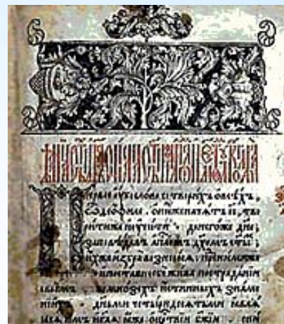
« Апостол » Россия, XVI в.