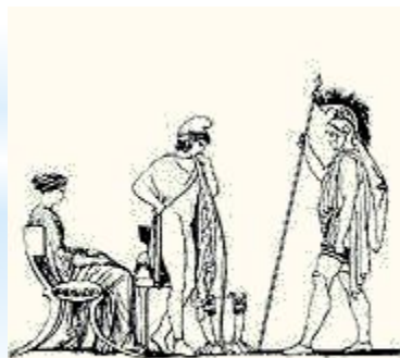
« Илиада » Древняя Греция