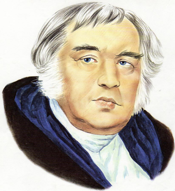
Крылов Иван Андреевич (1769-1844)