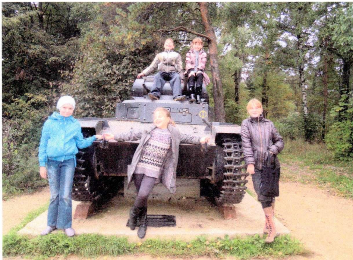
Около легкого немецкого танка TIL S