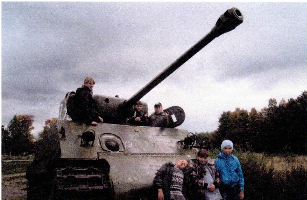
Американский средний танк шерман