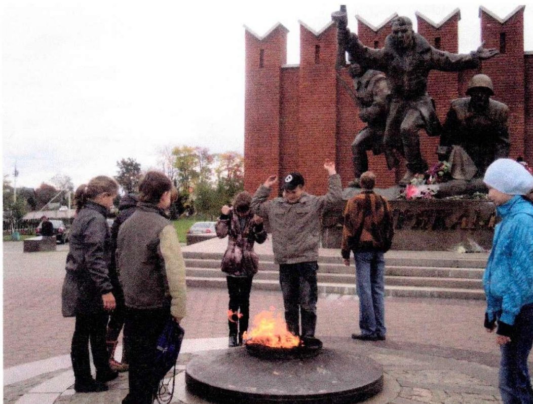
У Вечного огня и памятника войнам сибирякам