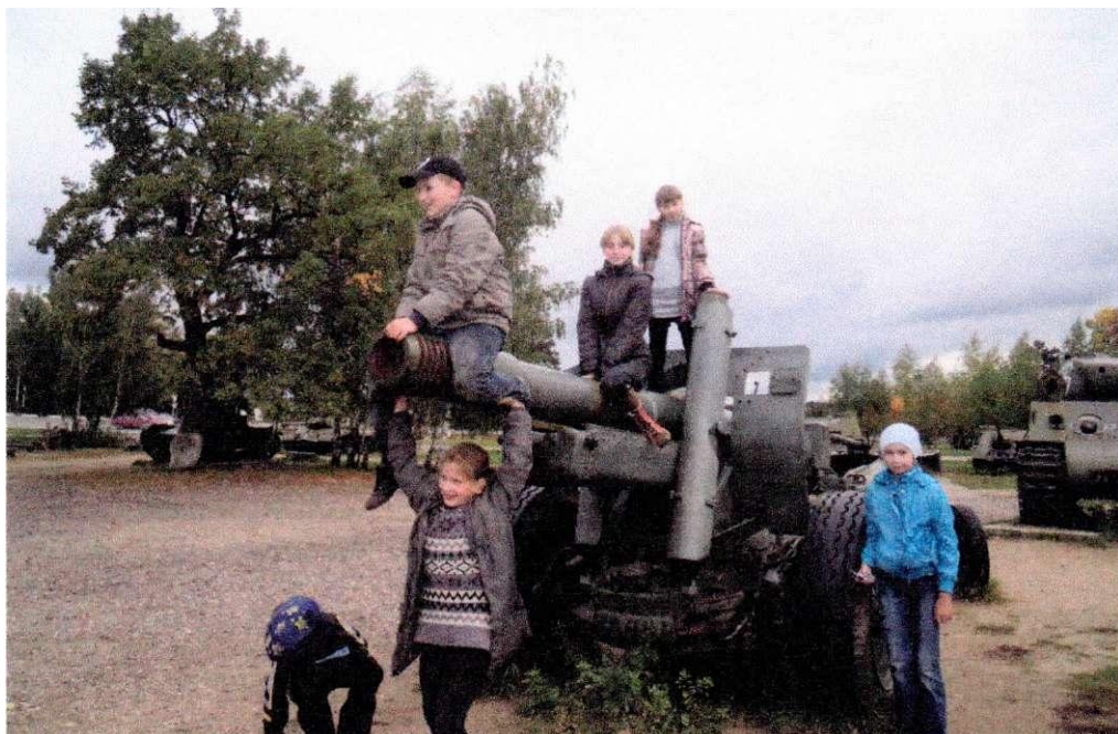
Тяжёлая советская пушка участвовавшая в обороне Москвы в 1941г.