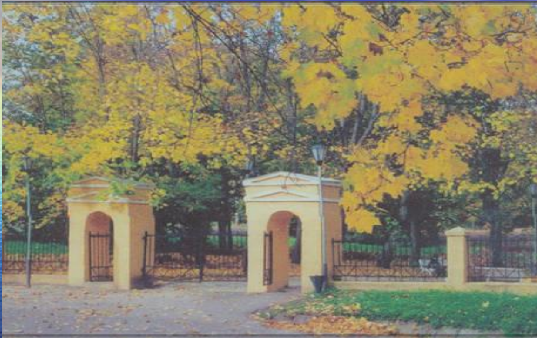
Въезд в усадьбу.