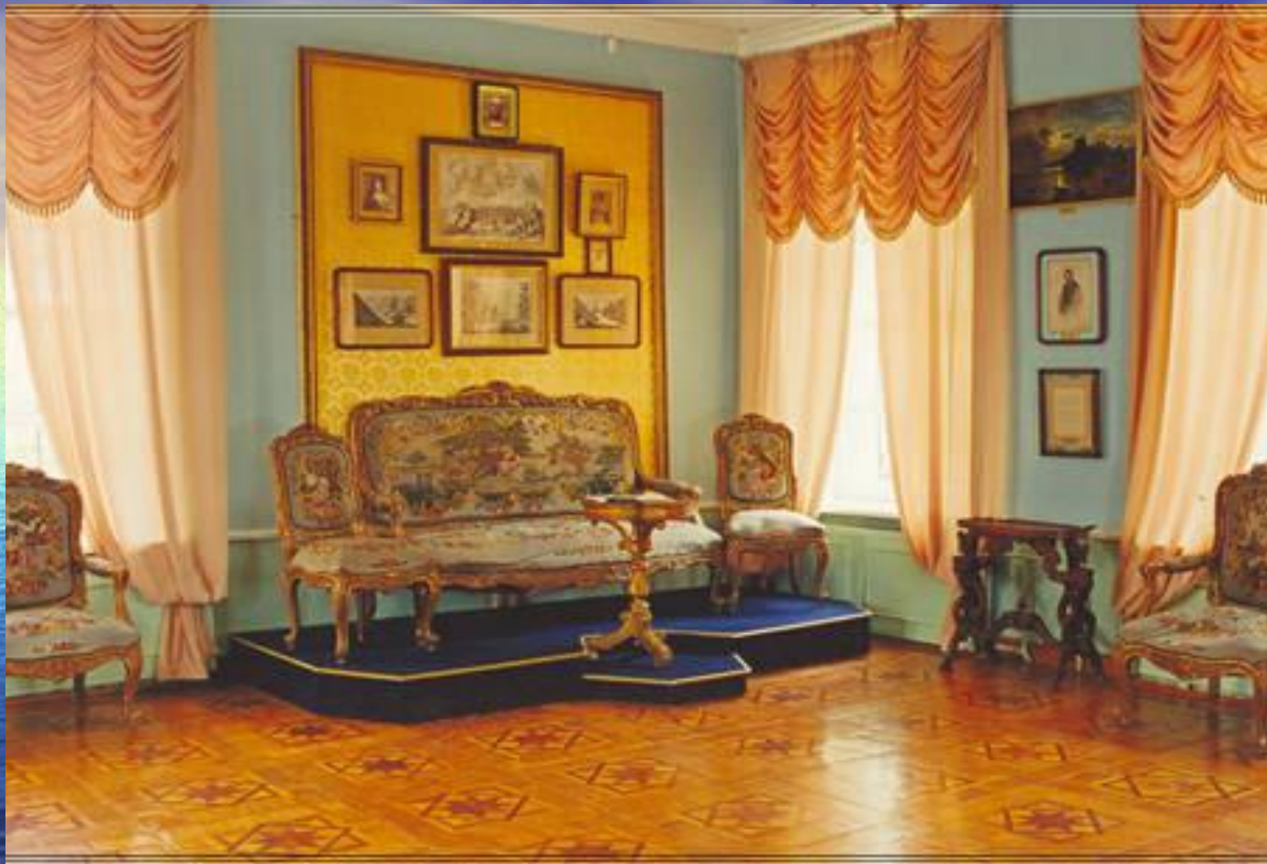
Дом. «Мюнхенский уголок».