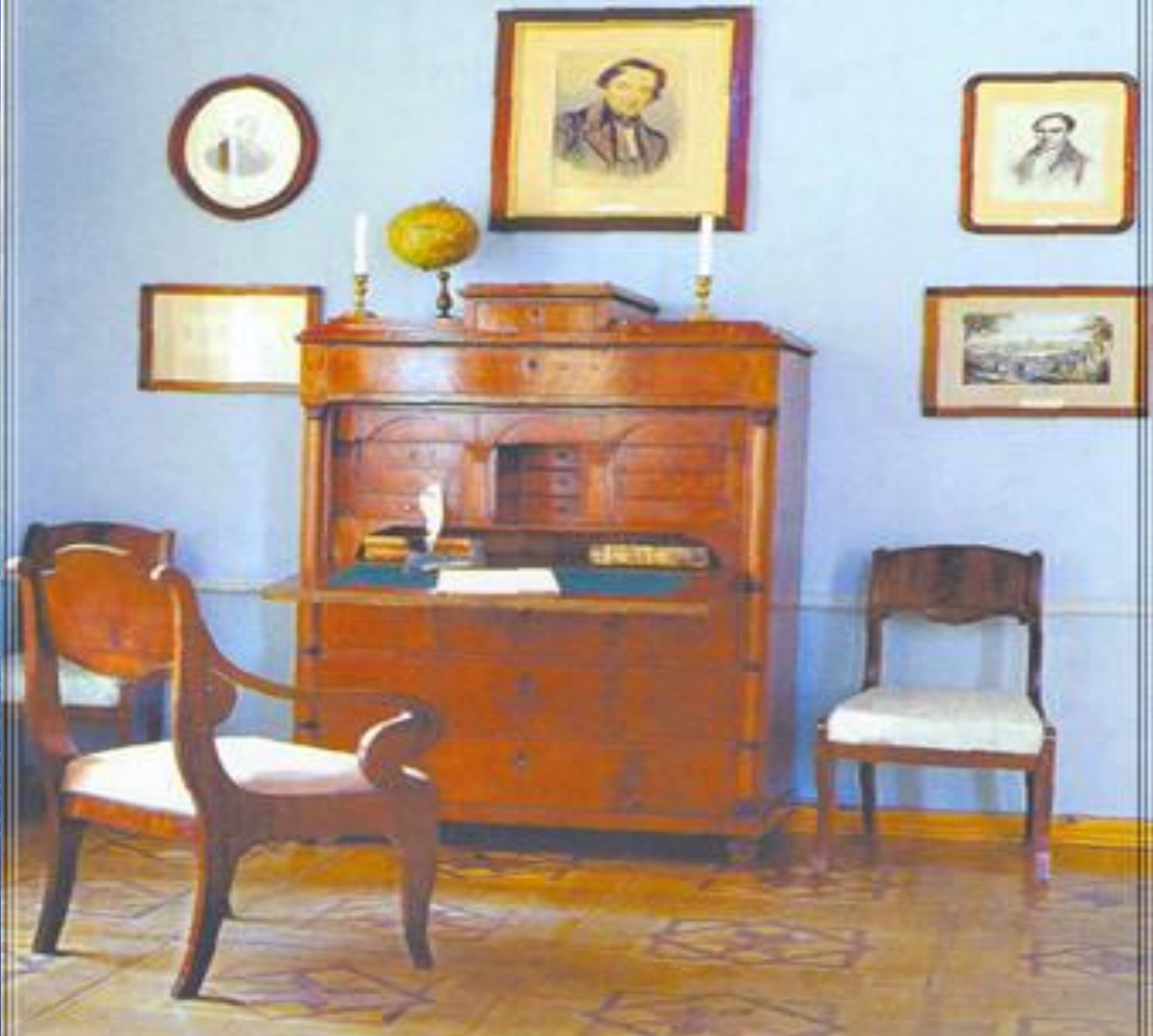
Дом. «Славянский уголок».