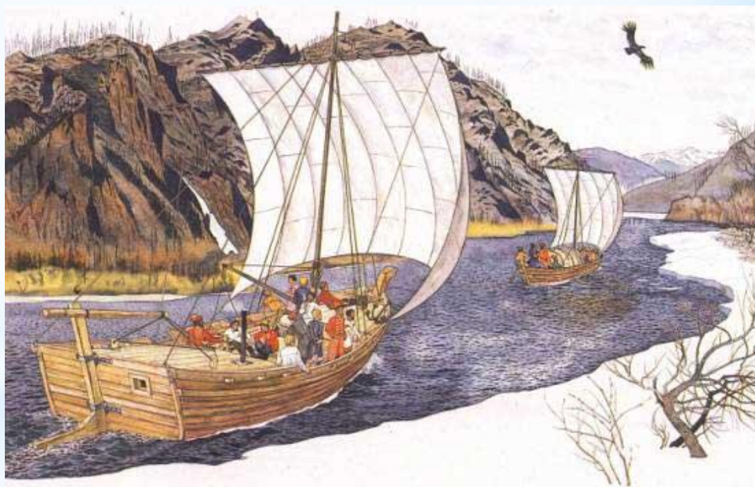
Немеркнущий подвиг русских землепроходцев и мореходов, открывших Приамурье и другие дальневосточные земли, жив в памяти потомков

Первооткрывателями Сахалина были русские казаки-землепроходцы, пришедшие на Амур из Якутска. Плыли они в стругах и в дощаниках по быстрым, порожистым рекам, шли горными тропами, брели тайгой, вновь плыли по рекам, оставляя на своем пути укрепленные пункты - "остроги". Многие месяцы, а иногда и годы продолжался нелегкий путь.