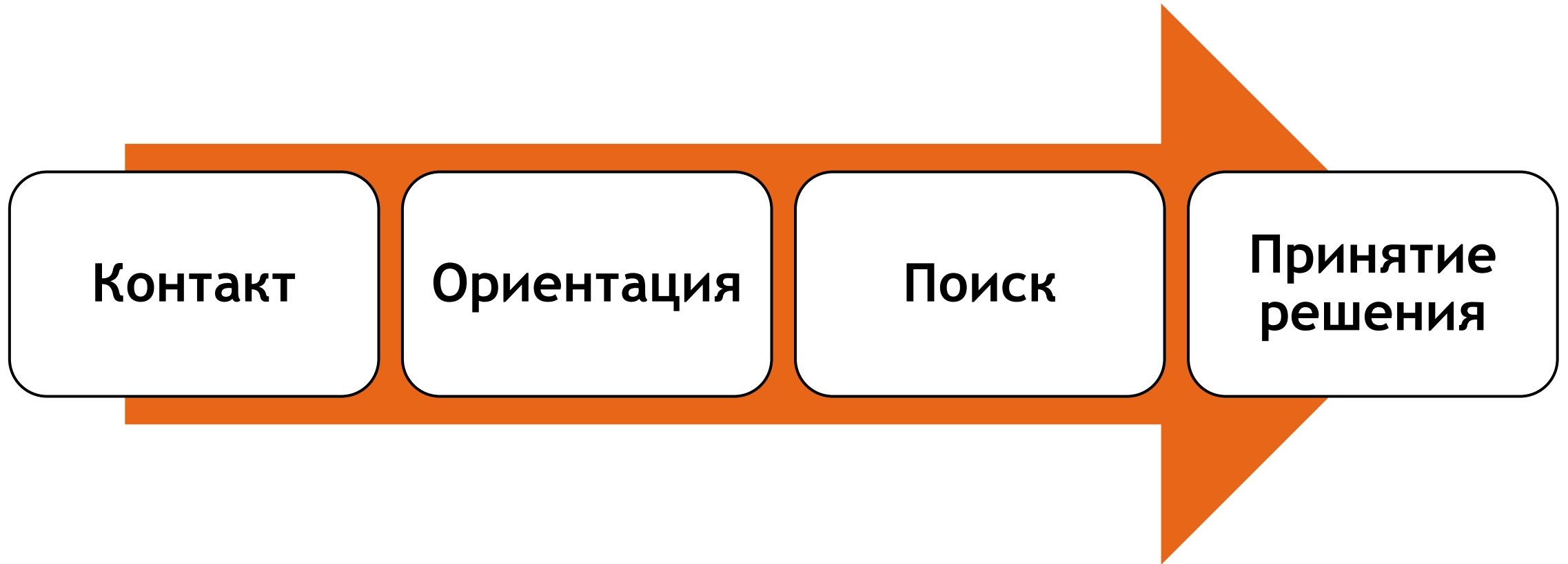
Схема стадий общения