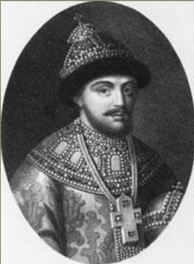
Михаил Федорович Романов