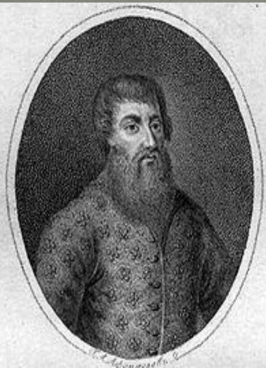
Князь Дмитрий Тимофеевич Трубецкой, Боярин.