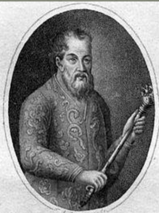
Князь Дмитрий Михайлович Пожарский, Боярин.