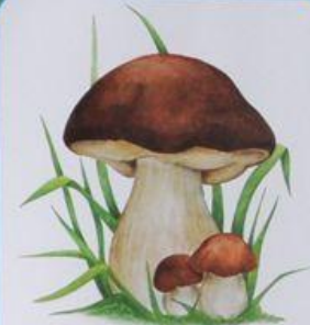
БЕЛЫЙ ГРИБ (БОРОВИК)

© «Слово А», иллюстрации 2011 © «Слово А», иллюстрации 2011 © «Алфавит», оформление 2014 0+ Перепечатано в печать 03.04.2014. Формат 420х290 Дизайн: Елена Ю. Юрлова. ООО «ЛЕДА» при участии ООО «АЛФОВИТ» 214030, РФ, Смоленская обл., М. Рославль, д. 412 д. 10, пер. в сторону д. 107, стр. 1, кв. 10 Виларус, г. Вилейка, ул. Ленінградская, Дз. № 19 e-mail: info@leda.by, www.leda.by Оформлено ООО «Смолдизарт» в Рославле, 150044, РФ, Смоленская обл., Рославль, ул. Пушкинская, д. 10