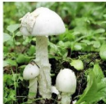
МУХОМОР БЕЛЫЙ ВОНЮЧИЙ