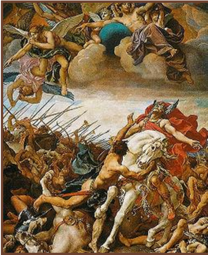
Битва при Толбиаке. Смерть короля вестготов

IV – V вв. – Великое переселение народов