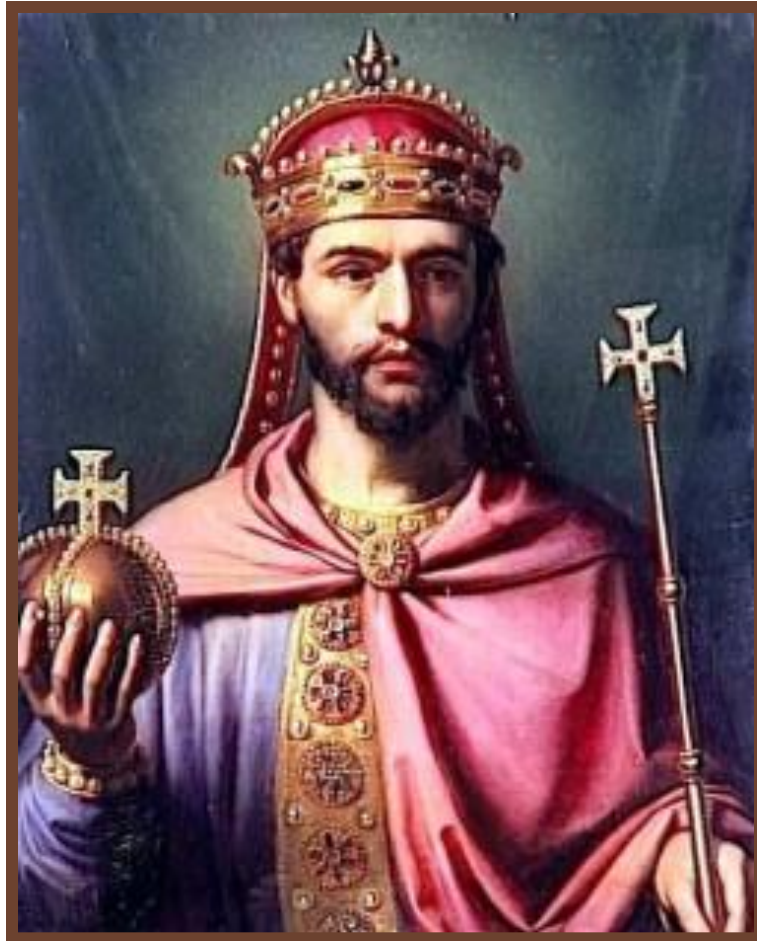
Людовик I Благочестивый

Смерть – развал империи. 814 - 840 г. – Людовик I – выделил земли Лютарю, Людовику и Карлу – усобицы 843 г. – Верденский раздел. Феодальная раздробленность. «Вассал моего вассала - не мой вассал».