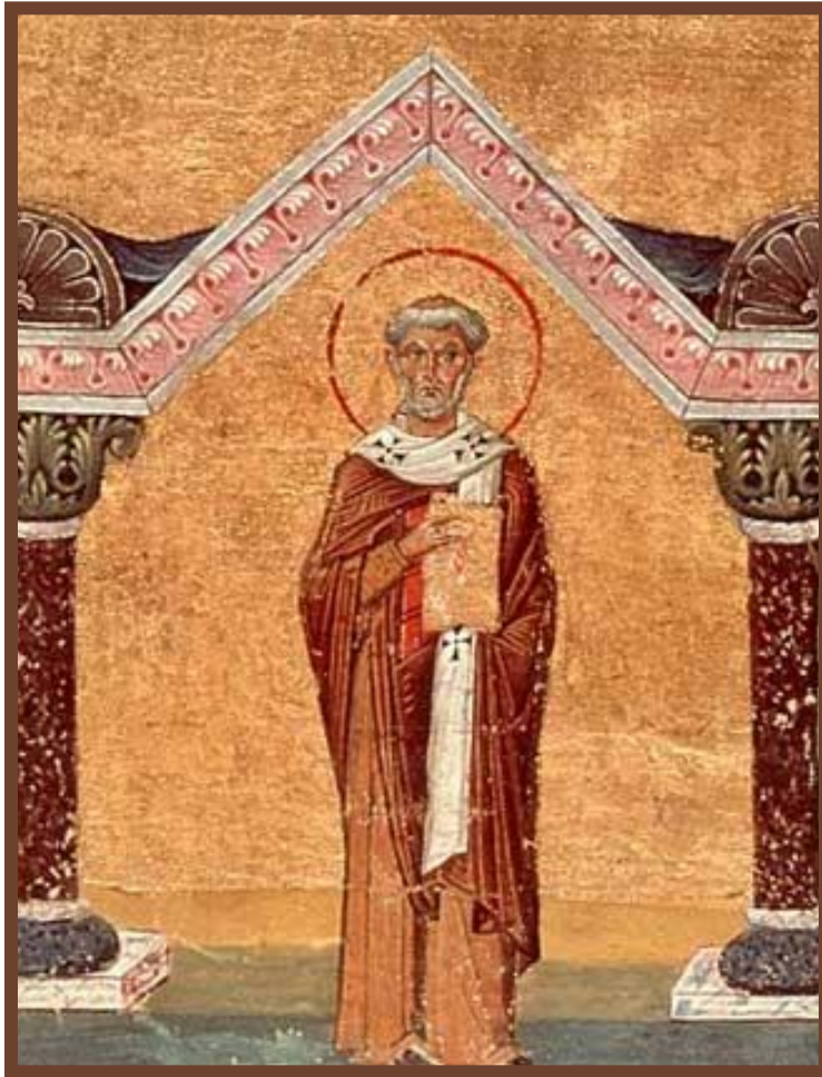
Папа Лев I

«Папы – спасители Рима» 450-е гг. – Лев I – Атилла, Гейзерих (отказ от разорения, смягчение грабежей).