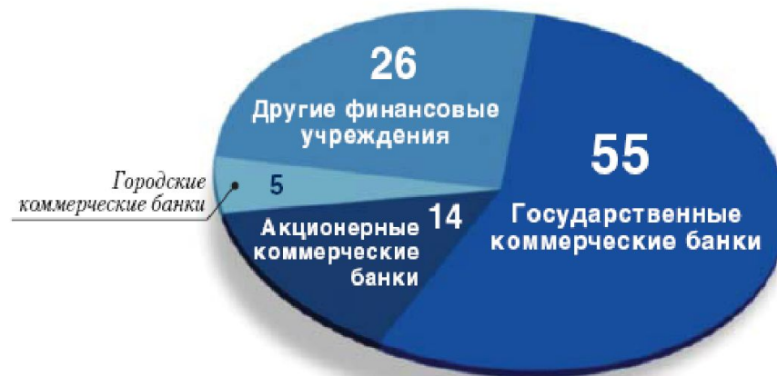
Совокупный собственный капитал финансовых учреждений Китая (процентов)