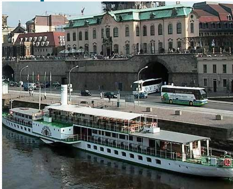
Теплоход ПРИ плыл