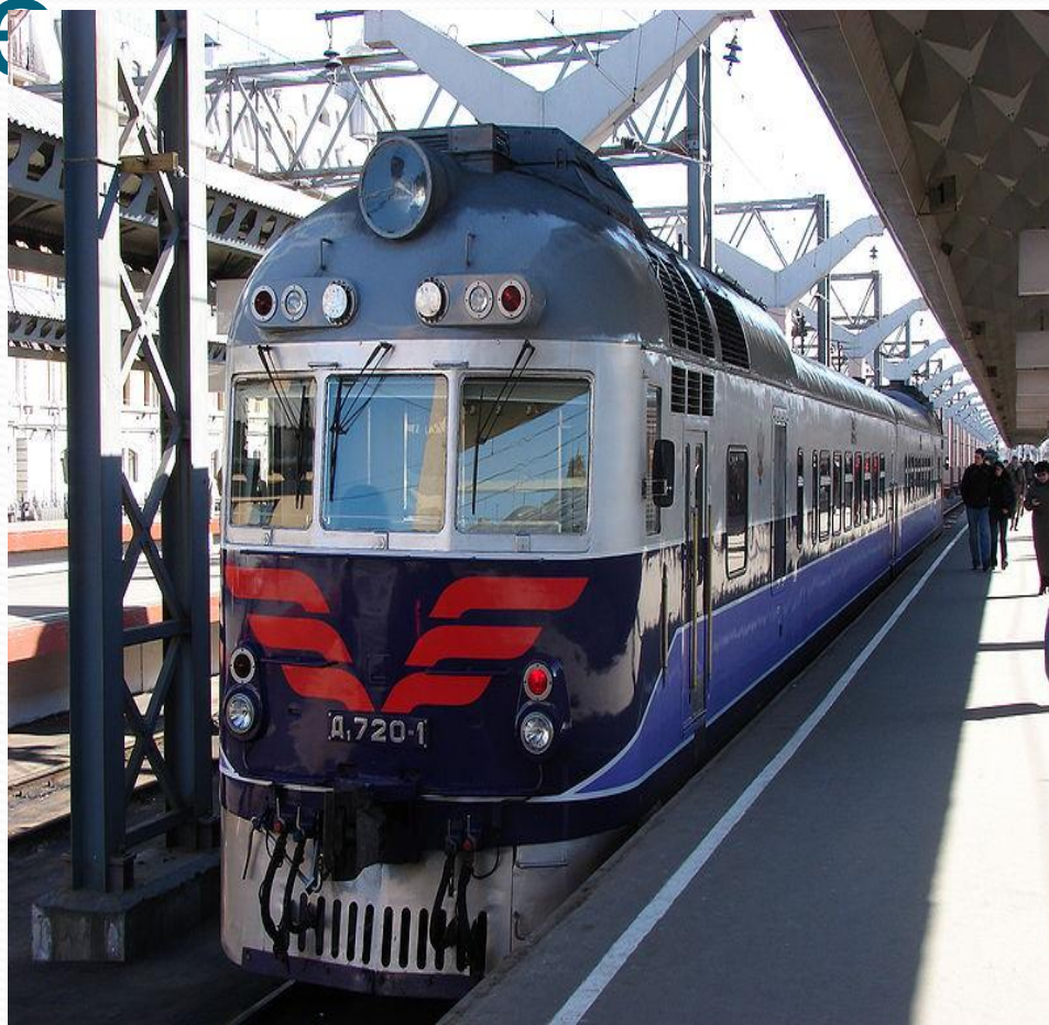
Поезд ПРИ ехал