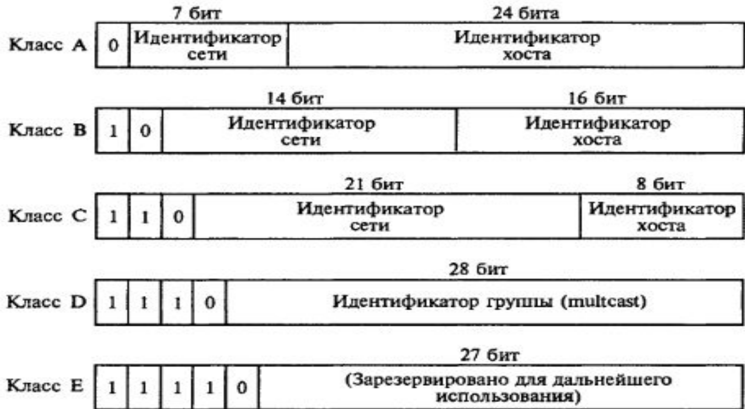
Рис.1 Классы адресов в сети Интернет

Каждый узел в объединенной сети, как указывалось выше, должен иметь свой уникальный IP-адрес, состоящий из двух частей — номера сети и номера узла. Какая часть адреса относится к номеру