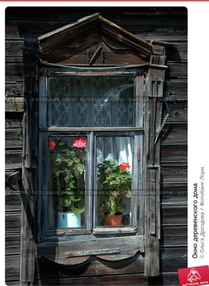
Окно деревенского дома

Чтобы сберечь тепло в избе, окна делали небольшими, из бычьего пузыря или кусочков полупрозрачной слюды. Как вы думаете, в доме было светло?