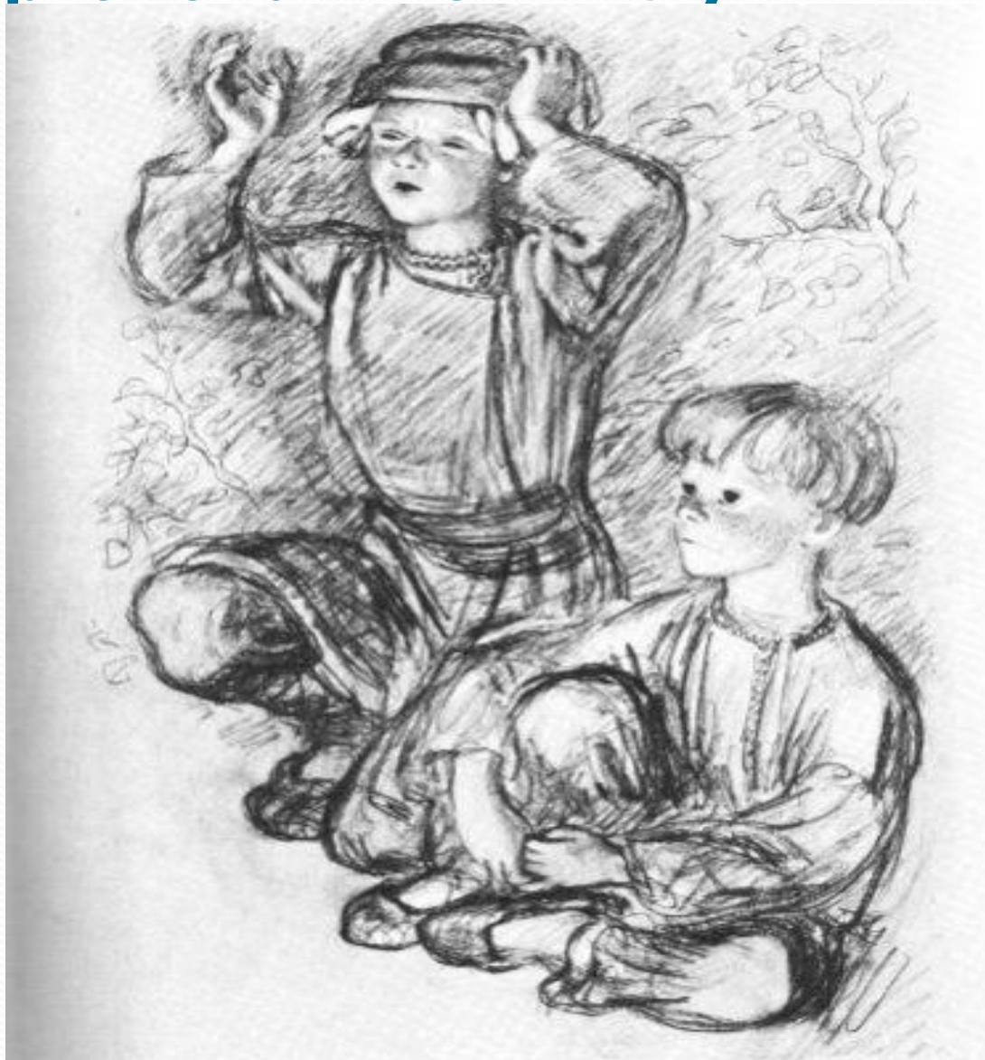
Иллюстрация к книге И. С. Тургенева «Бежин луг»