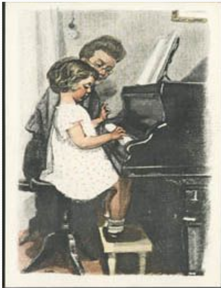
Урок музыки. 1958.