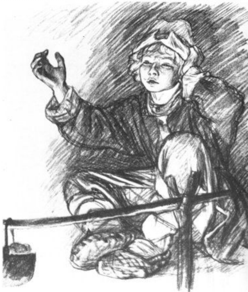
Иллюстрация к книге А.Н. Толстого «Рассказы о детях»