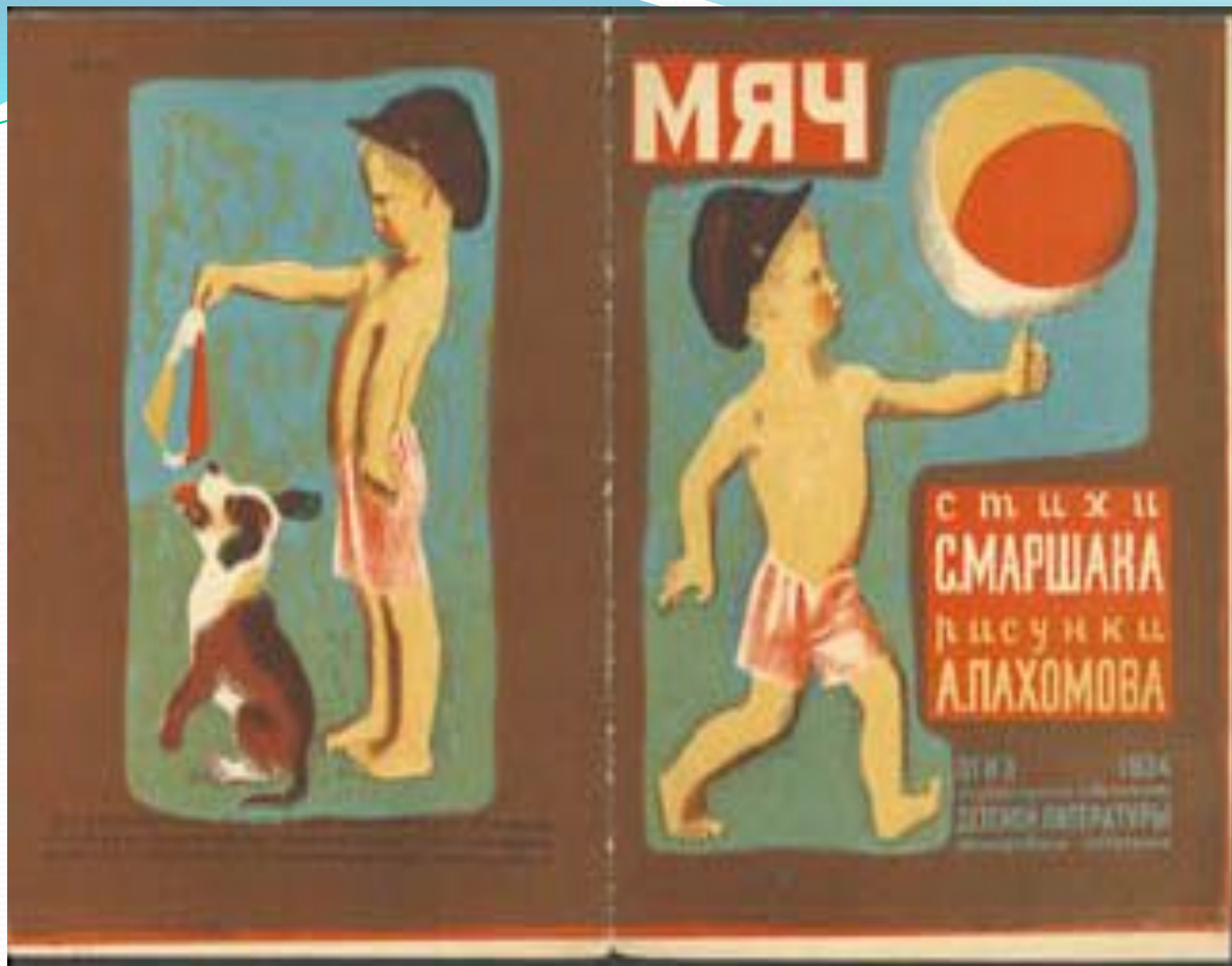
Обложка книги С.Я.Маршака 'Мяч'. 1934.