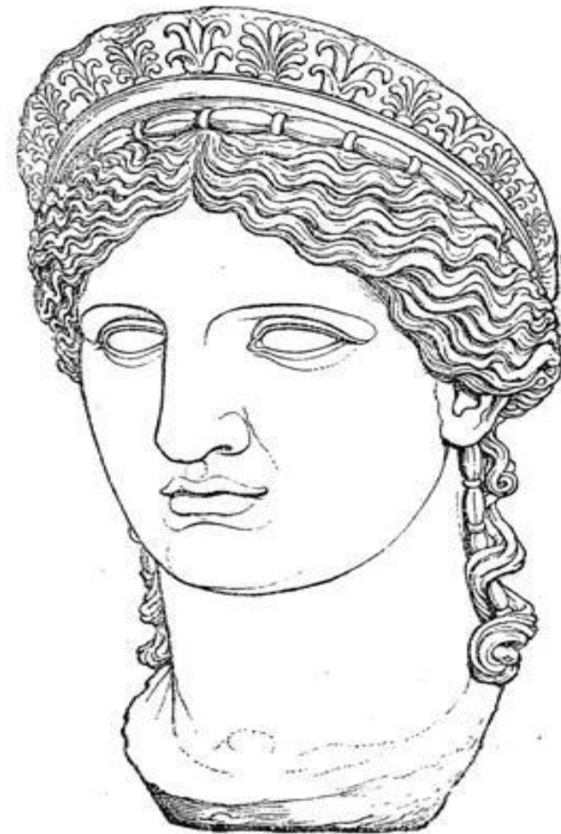
Fig. 2. Kopf der Hera Ludovisi (Rom, Villa Ludovisi).