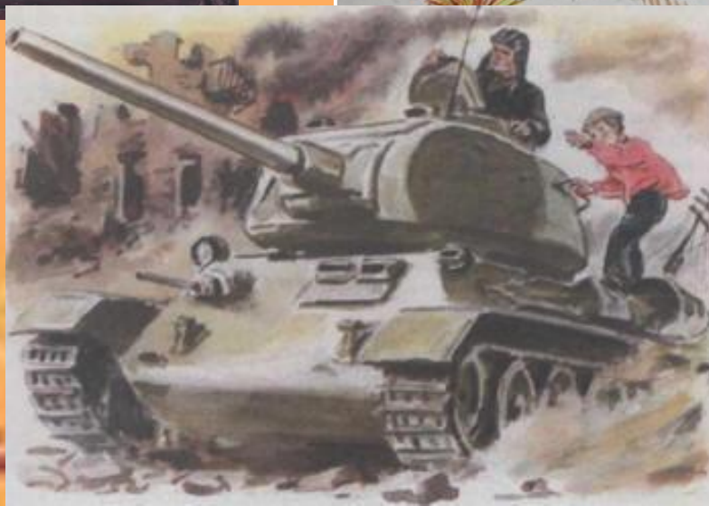
ТАНКИСТА Максим, 7 лет