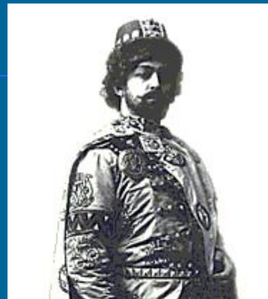
Леонид Собинов в опере А. С. Даргомыжского «Русалка».

Собинов во время исполнения партии Ленского