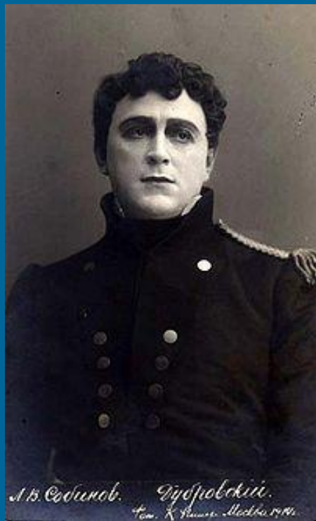
Л.В.Собинов в роли Дубровского (1913)