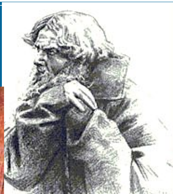
Федор Шаляпин в роли Ивана Сусанина..