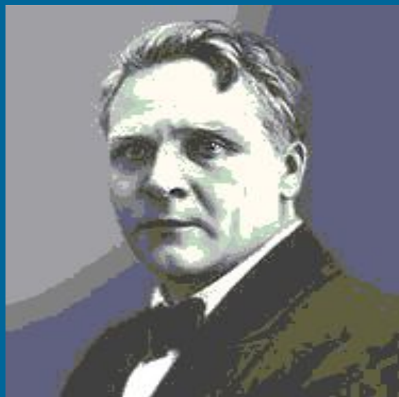
Ф.И. Шаляпин в роли Бориса Годунова. 1912 год