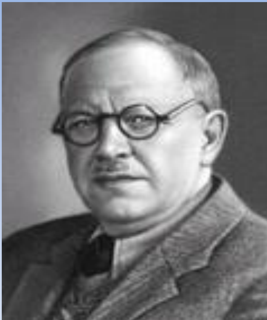
Пётр Петрович Кончаловский (1876-1956 гг.)