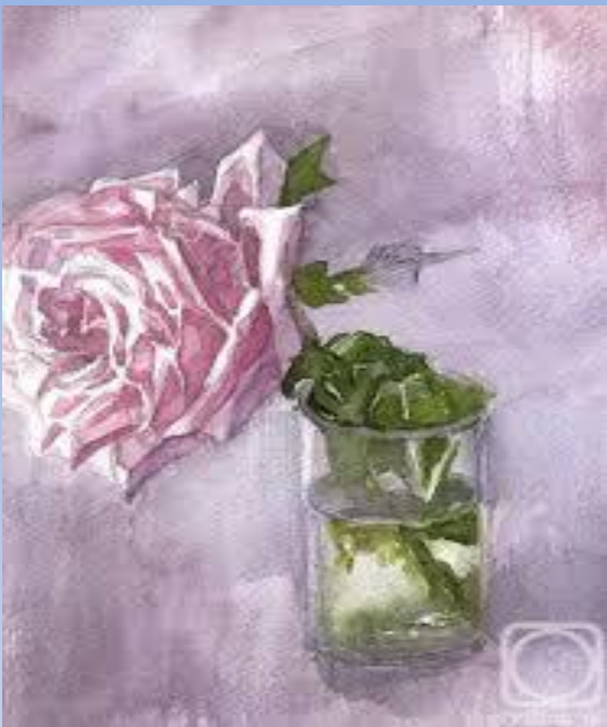
М. Врубель «Роза»