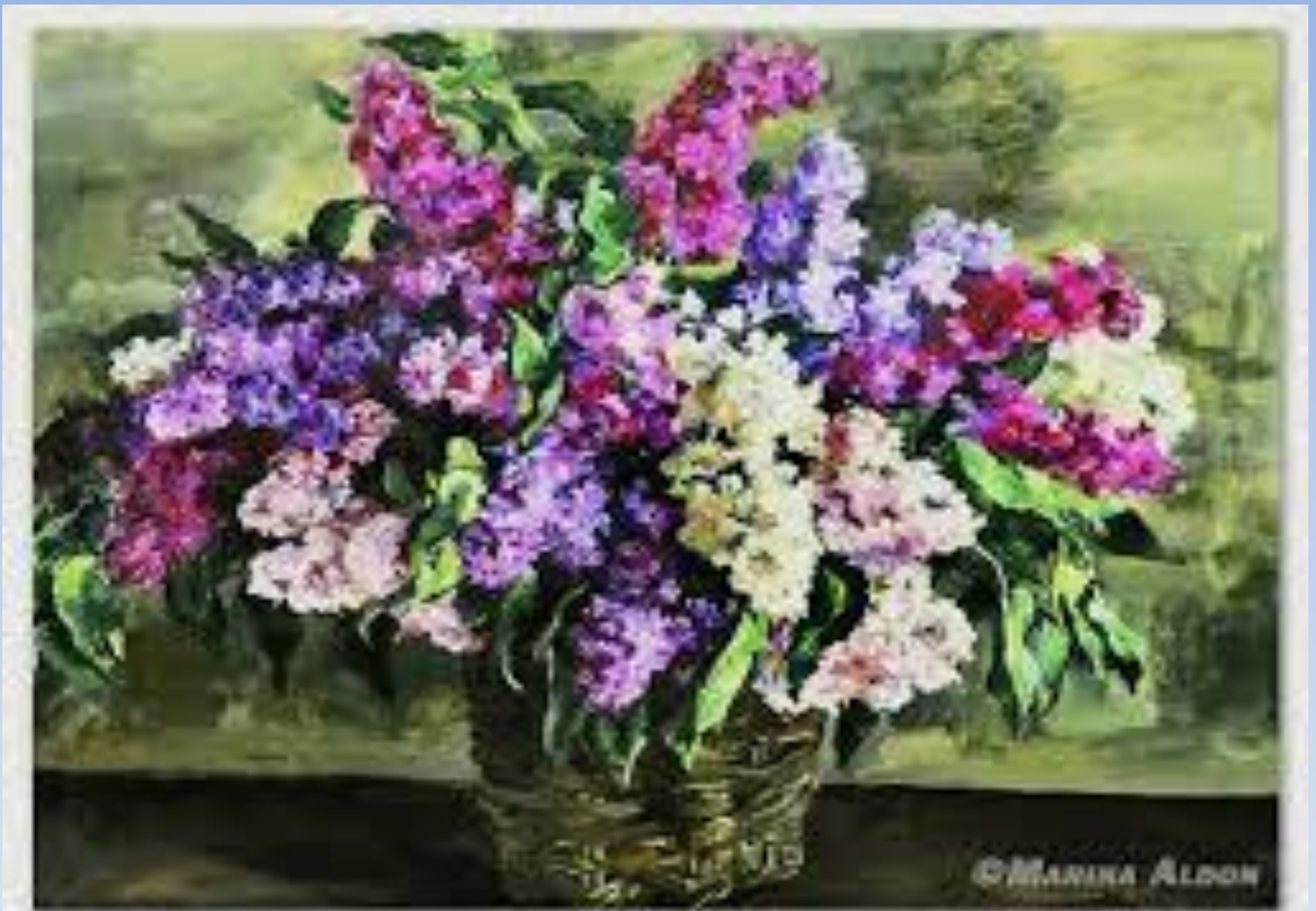
«Сирень в корзине»