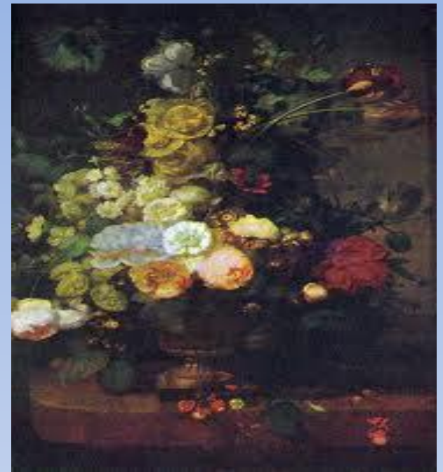
Жан Прево «Букет»