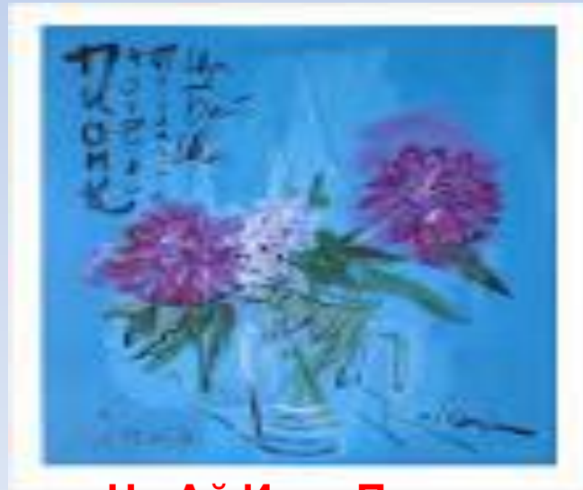
Ци Ай Ине «Пион»