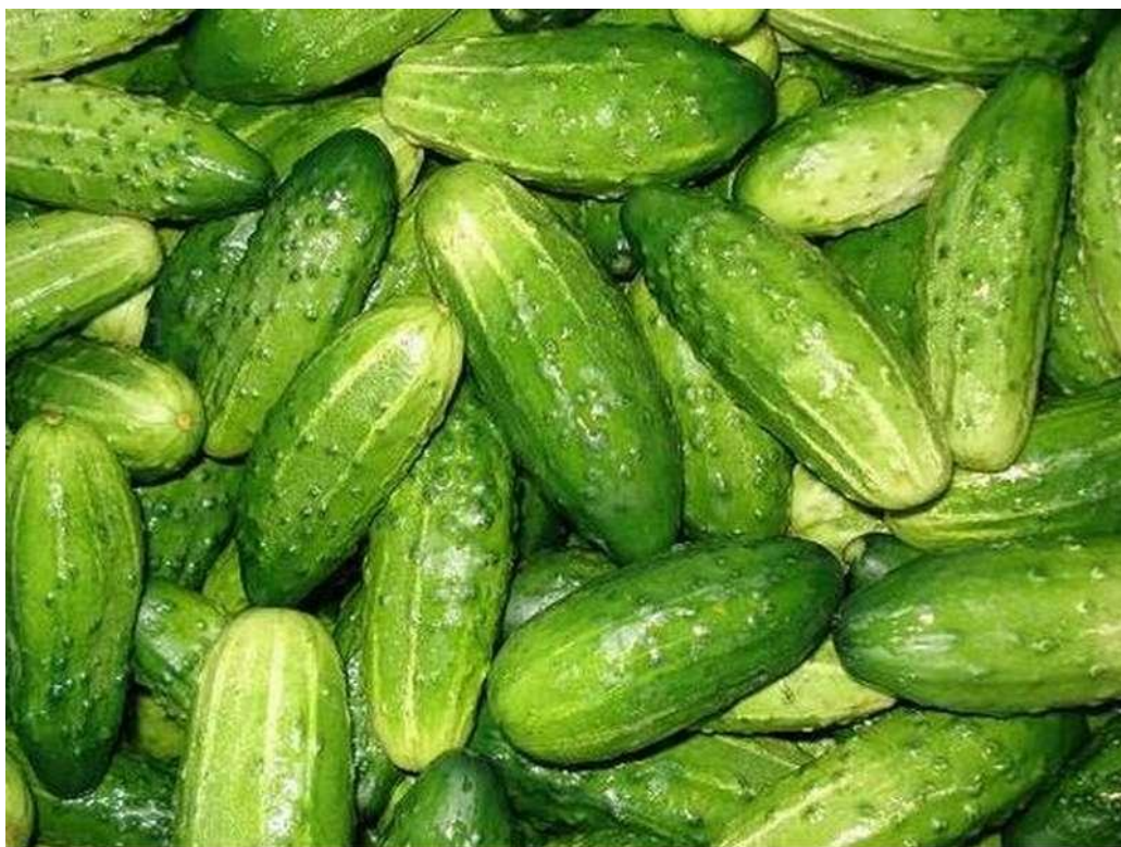
Огурцы на 96% состоят из воды