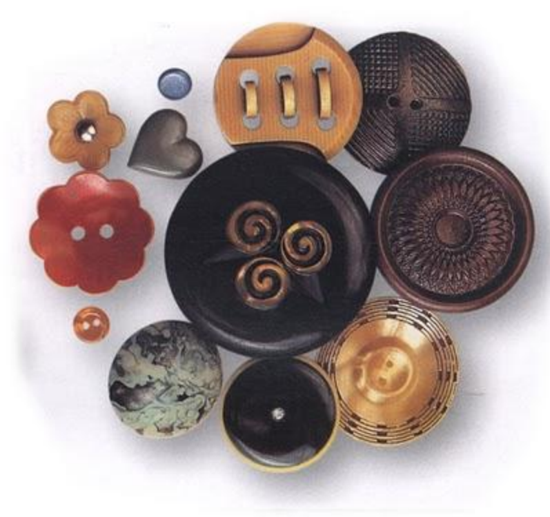
Пластмассовые пуговицы. США. 30-е гг. XX в.