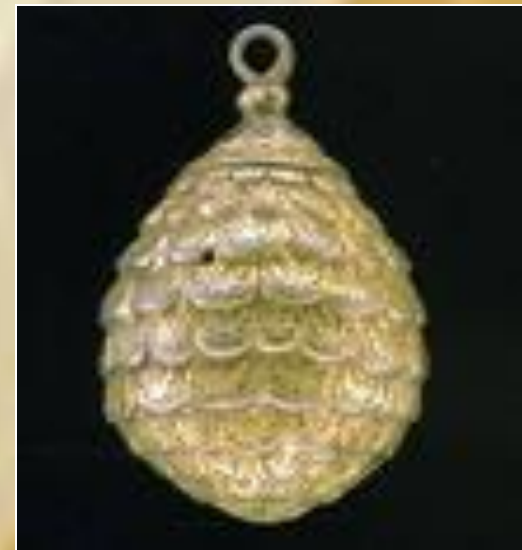
Пуговица. Серебро. Вторая половина 17 века.