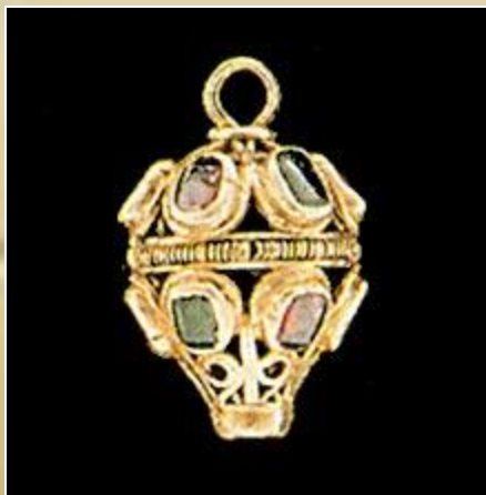
Пуговица. Золото, рубины, изумруды