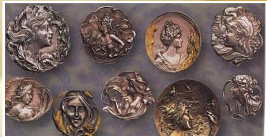
Серебряные английские и французские пуговицы в стиле модерн. 1900-1910 гг.