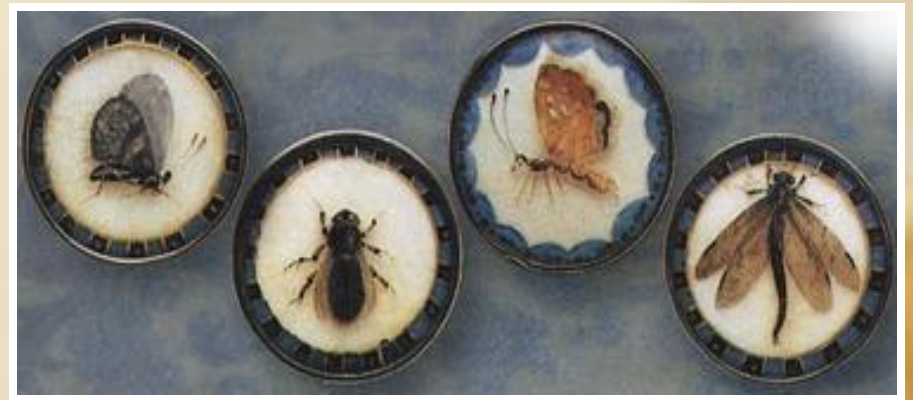
Пуговицы с изображением насекомых, покрытые стеклом. Середина или конец XVIII в.