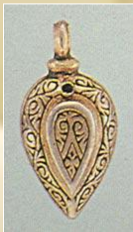
Пуговица. Серебро, позолота.