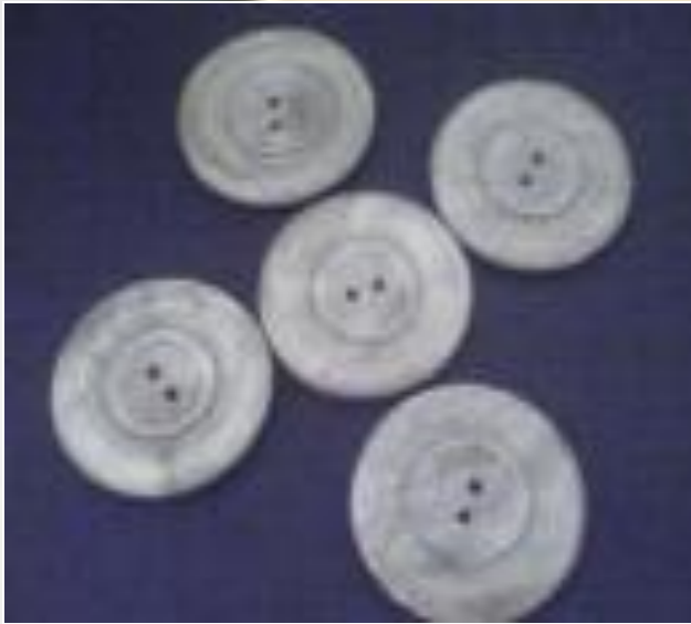
Пуговицы 1930-2000 гг. Фотогалерея. Музей Моды...