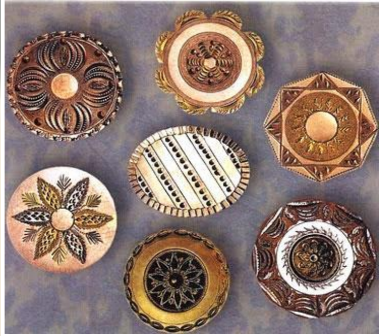
Медные пуговицы. Предположительно Англия. XVIII в.