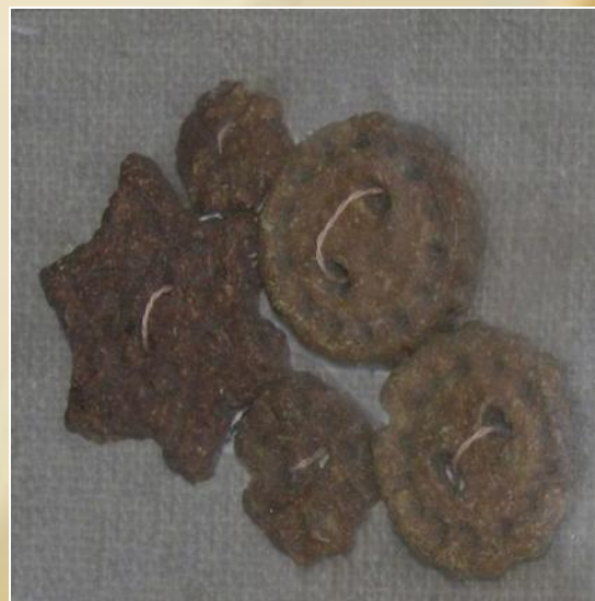
Пуговицы из хлеба