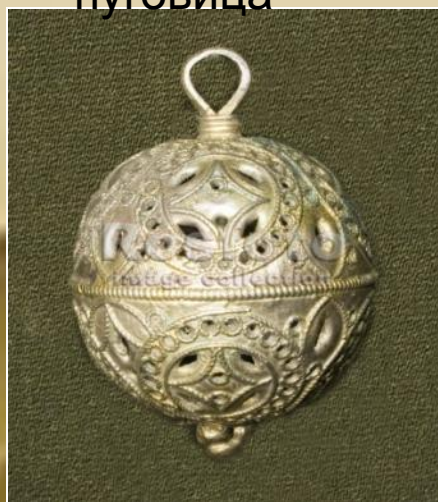
Пуговица 16-18 век