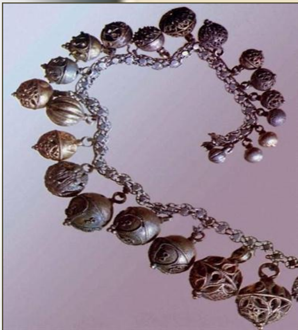
Цепь с пуговицами