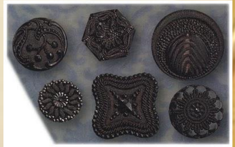
Пуговицы из черного стекла