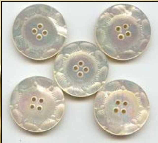
Пуговицы перламутр 19 век