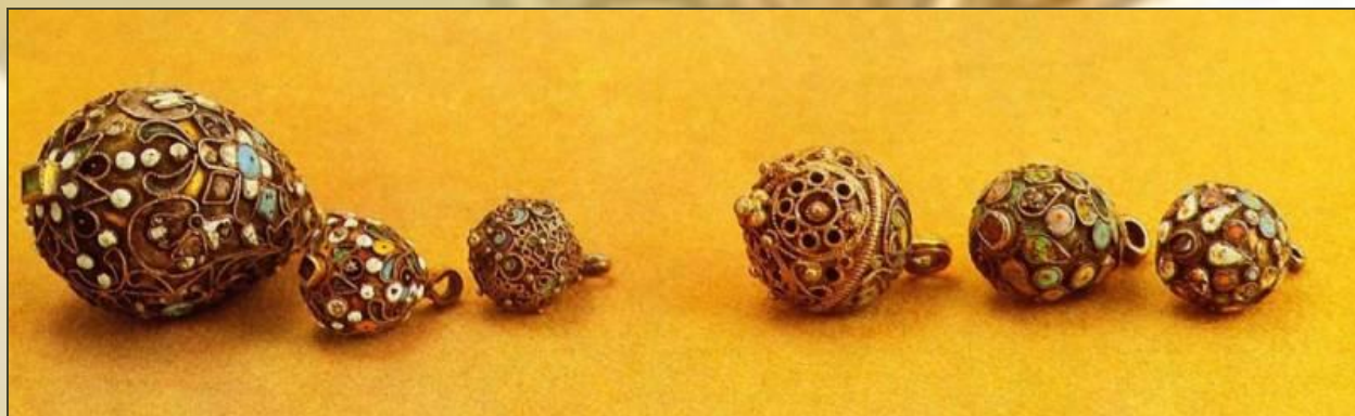
Пуговицы 16 - 17 век Серебро; скань.