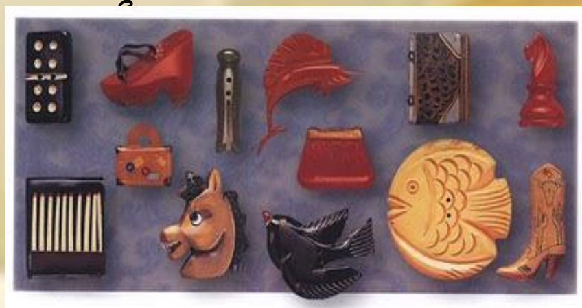
Пластмассовые пуговицы. США. 30-е гг. XX в.

В 20-е гг. XX века были наиболее распространены пуговицы из пластика бакелита , именовавшегося «материалом тысячи возможностей».