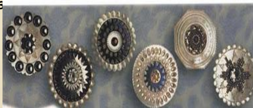
Пуговицы из целлулоида. Начало XX в.