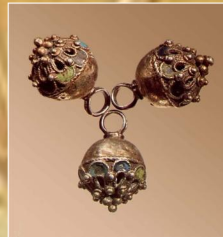
Пуговицы 17 век