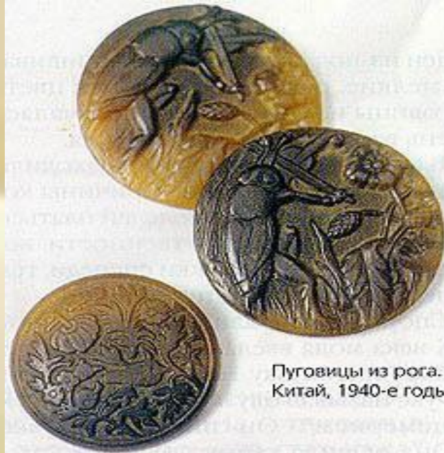
Пуговицы из рога. Китай, 1940-е годы.