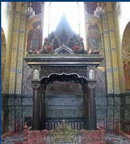
Сень над местом ранения