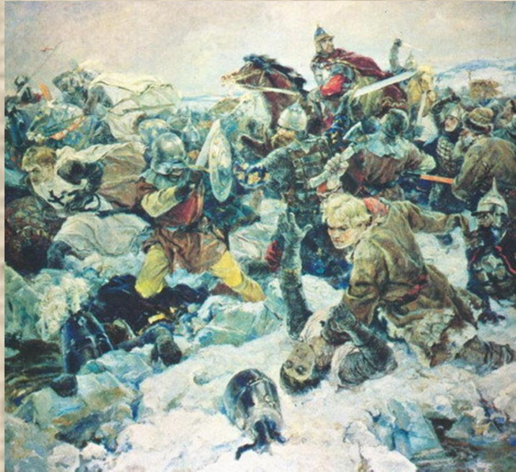
Серов Владимир. Ледовое побоище. 1942 год.