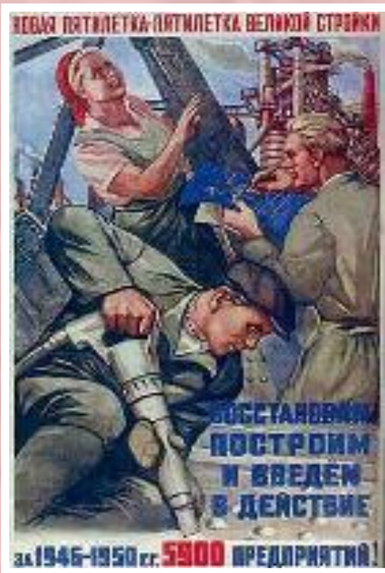
Плакат 1946 г.

Тем не менее главным источником восстановления оставалось село-закупочные цены в 10-12 раз были ниже розничных. На восстановлении работали пленные и узники ГУЛАГа. Огромную роль продолжало играть соцсоревнование. Токарь Г.Борткевич в 1948 г. выполнил 13 сменных норм за день. К 1949 г. экономика была восстановлена плановое задание было перевыполнено в промышленности на 70% в сельском хозяйстве - на 48%.