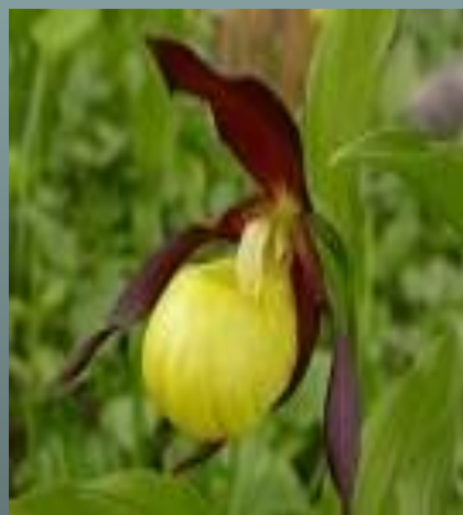
Венерин башмачок настоящий