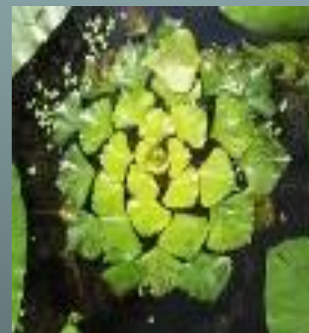
Водяной орех плавающий