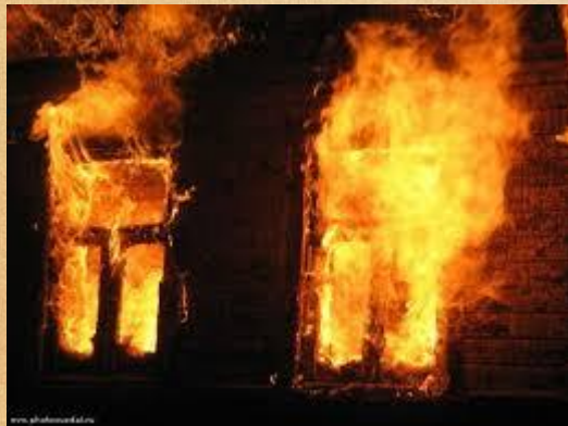
ПОЖАР 1957 ГОД

Отец работал шофером. Лето. Июнь. Праздник Троицы. Все колхозники на прополке кукурузы. В Районе слет пионеров. Отец везет их на слет. Уже отъехал от деревни километров 10. Проехал соседнюю деревню Сухоречку. Вдруг по кабине стук и крик, горит деревня. Отец разворачивает машину и в деревню. Но опоздал. Деревня полыхала, а ветер играл то с одной стороны, то с другой. Крыши домов были соломенные. Он к своему дому. Дом полыхает, а в доме старая мать и сын на печке. Он их в охапку и на улицу. Затем вбегает обратно, начал вытаскивать сундук, дно у сундука вываливается и все нажитое добро падает в огонь. Деревня в течении 40 минут почти сгорела дотла. Было страшно. Особенно когда смотришь с горы. Одни трубы торчат, да гарь кругом. Жить не где. Кто в бане, кто в подвале, если он уцелел. За короткое время- это летний период, людям надо было отстраиваться. Кто- из сельчан переехал в города Лениногорск и Бугульму. А в деревне две машины. На самосвал сел отец. И вы представляете себе, 24 часа в сутки надо было возить срубы и он их возил. Он помогал всем в ущерб себе. Так как иначе не мог, но в зиму мы вошли в свой дом. Строились всем миром, помогали всем и каждому. Отца благодарили, а чем? Бражкой, и он каждый день за рулем уставший. Однажды, вез камни на фундамент и попадает в аварию. Машина падает под мост. Никто не пострадал. Но мама сказала. За руль не сядешь. Будешь работать на тракторе. Так отец до конца своей жизни проработал на тракторе.