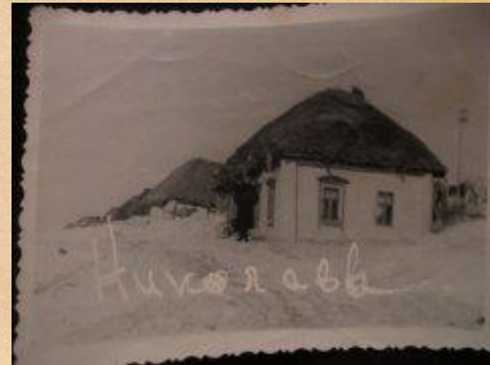
ДЕРЕВНЯ ДО 1957 Г.