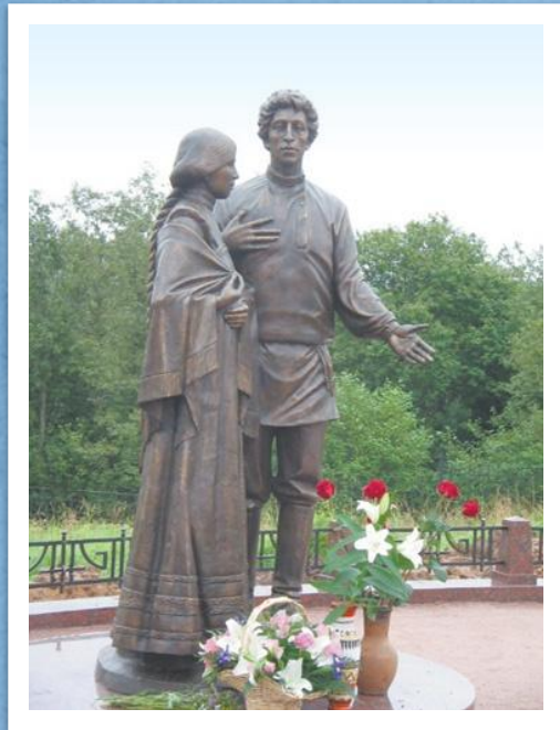
Памятник Блоку: рядом с прекрасной дамой