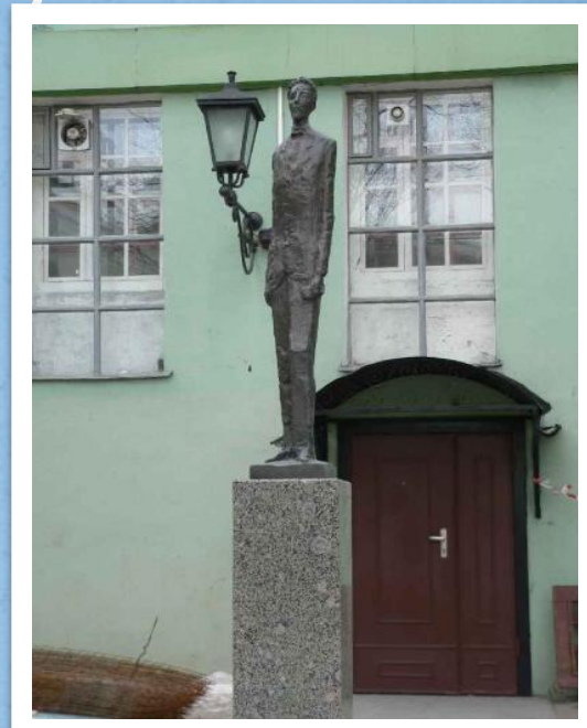
Памятник Александру Блоку во дворе филфака СПбГУ