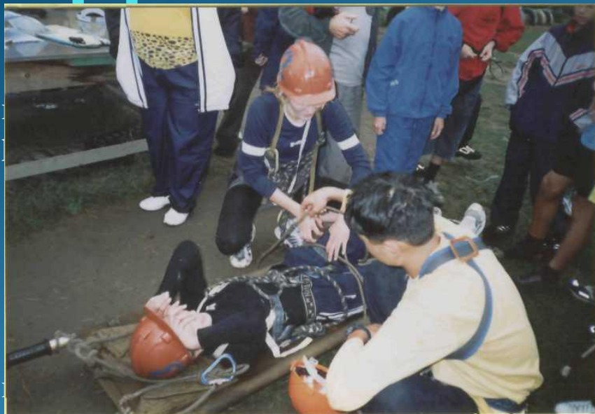
г.) в сор