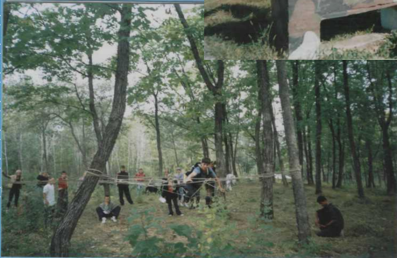
200 му ас е р ы «