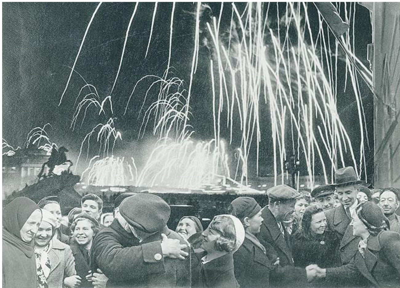
«Великая победа одержана советскими войсками под Ленинградом:

"Слава и тебе, великий город, Сливший воедино фронт и тыл. В небывалых трудностях который Выстоял. Сражался. Победил!"