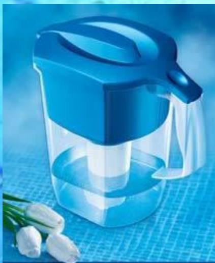
АКВАФОР КУВШИН РЕСУРС 300 ЛИТРОВ