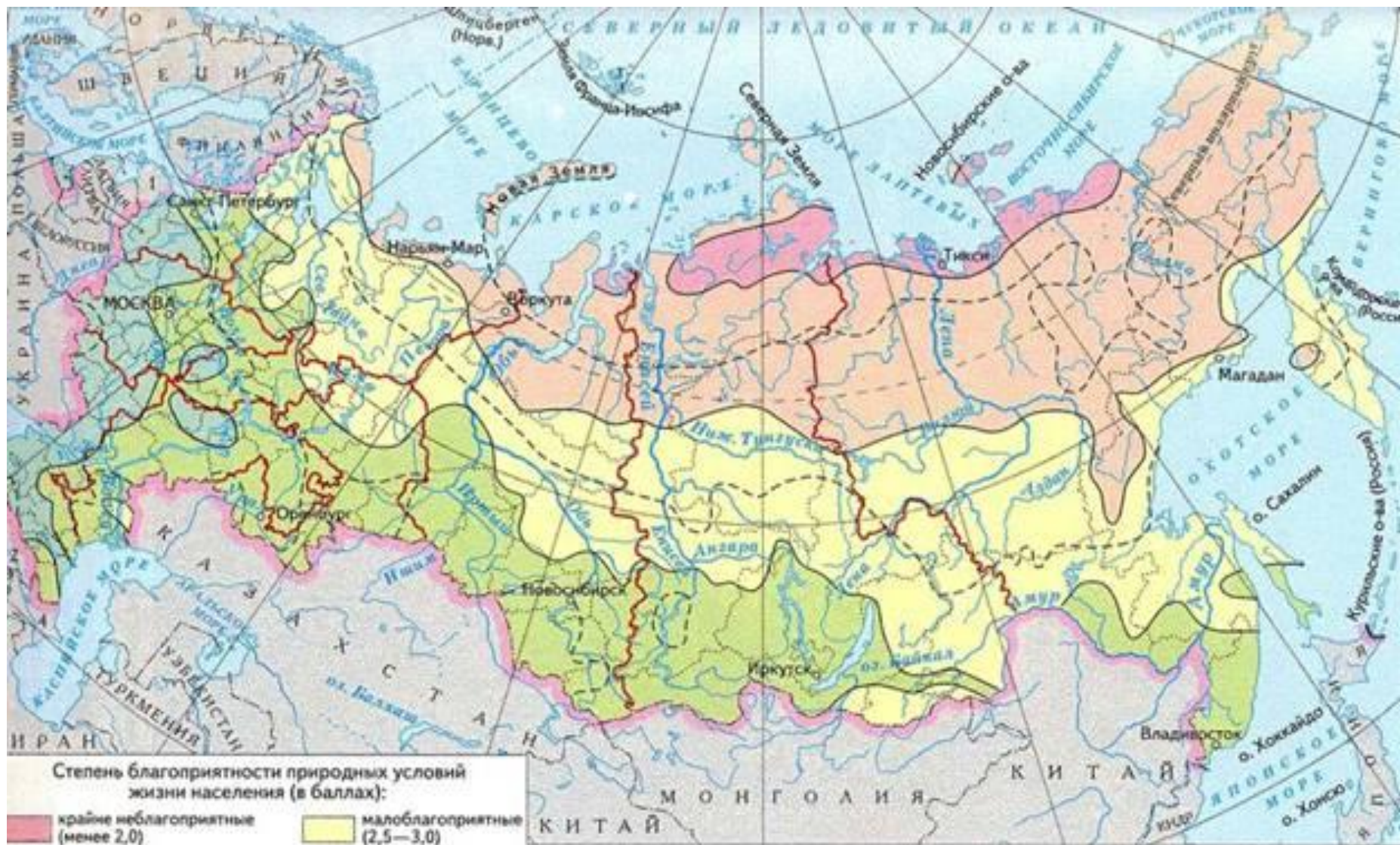
Степень благоприятности природных условий жизни населения