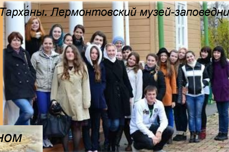
Тарханы. Лермонтовский музей-заповедник