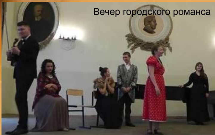
Вечер городского романса