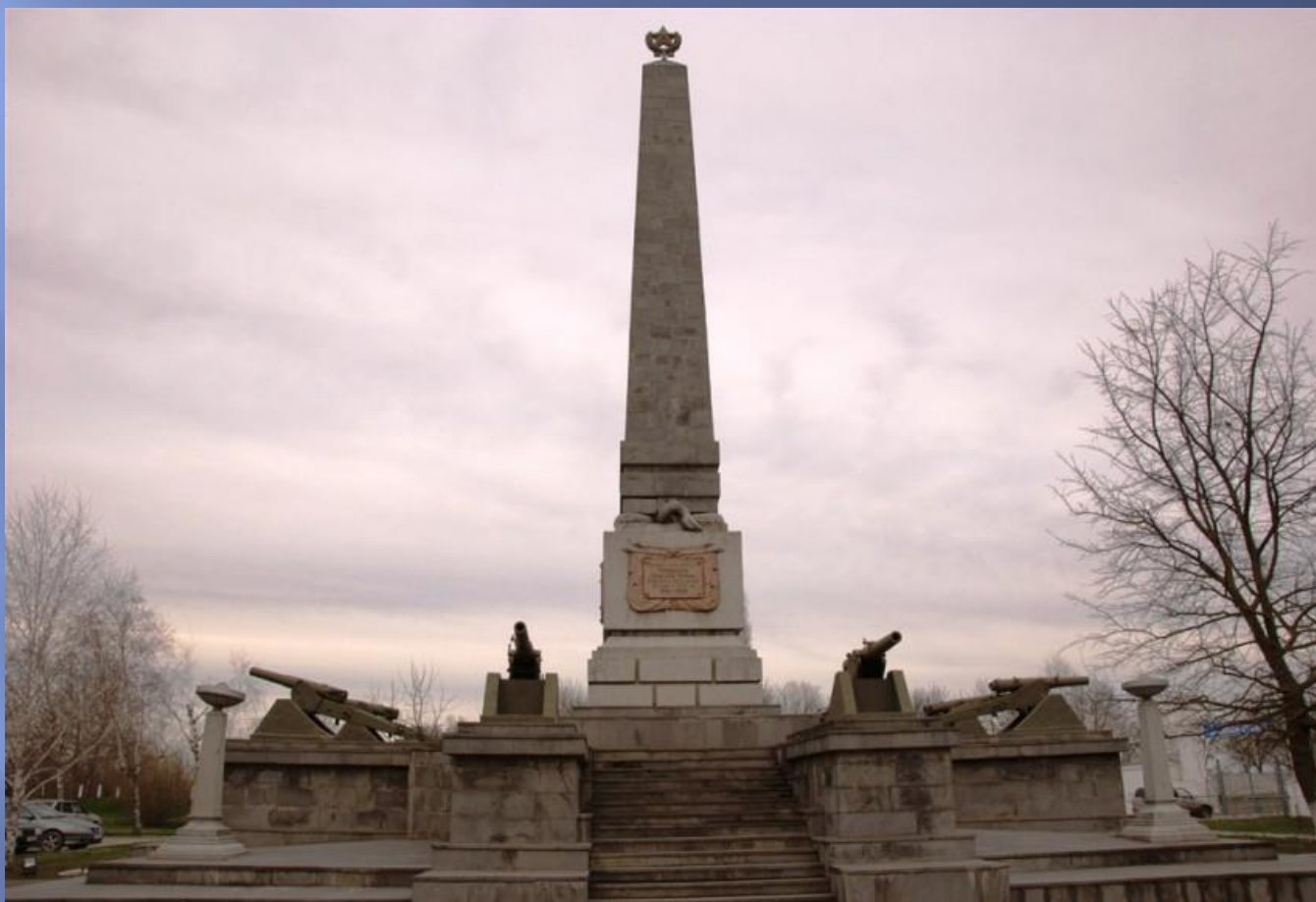
Памятник участникам Таманского похода, 1923 г.