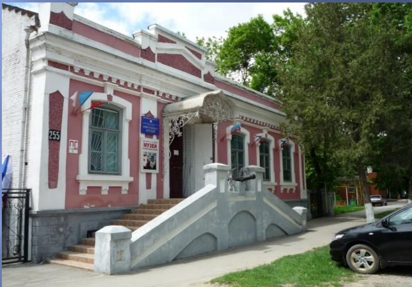
Славянский историко-краеведческий музей, 1976 г.