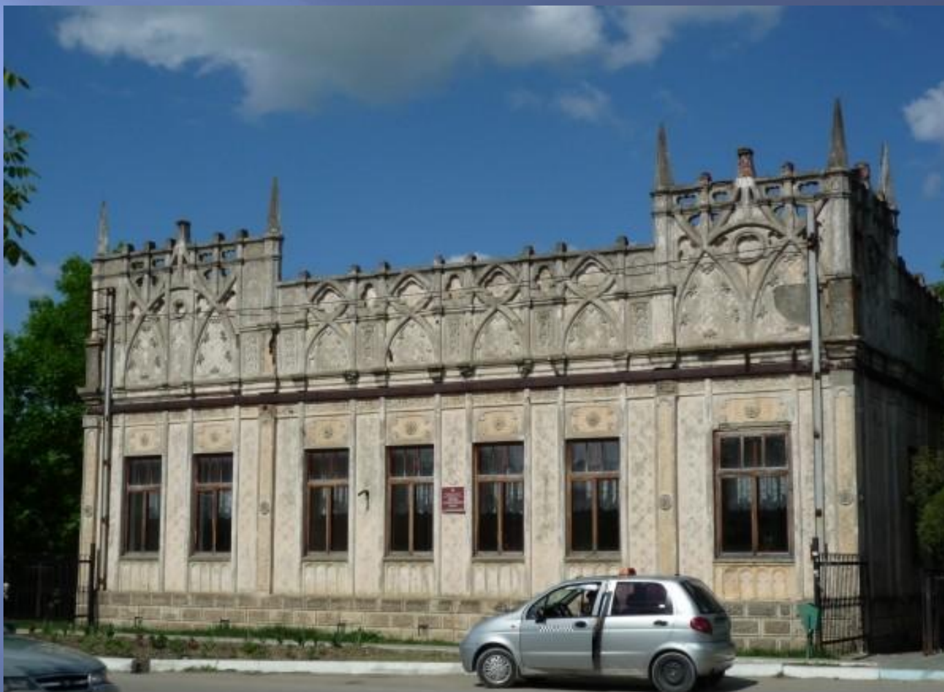
Детская художественная школа, 1970 г.