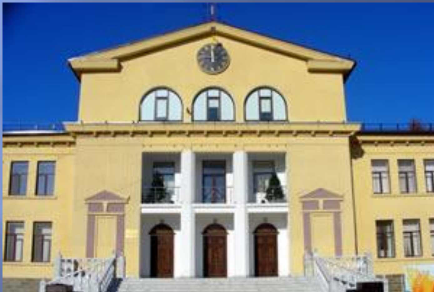
Городской дом культуры, 1958 г.