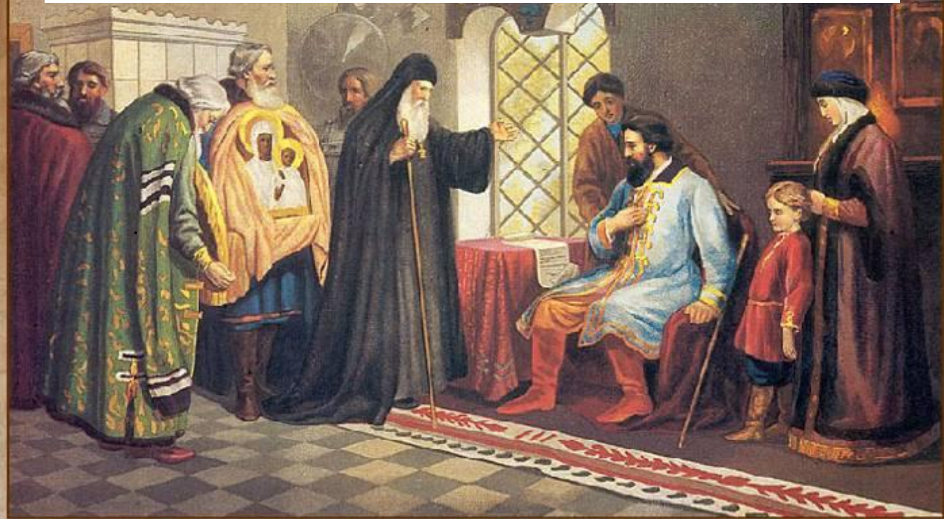
Нижегородские послы у князя Дмитрия Пожарского. 1611 г.