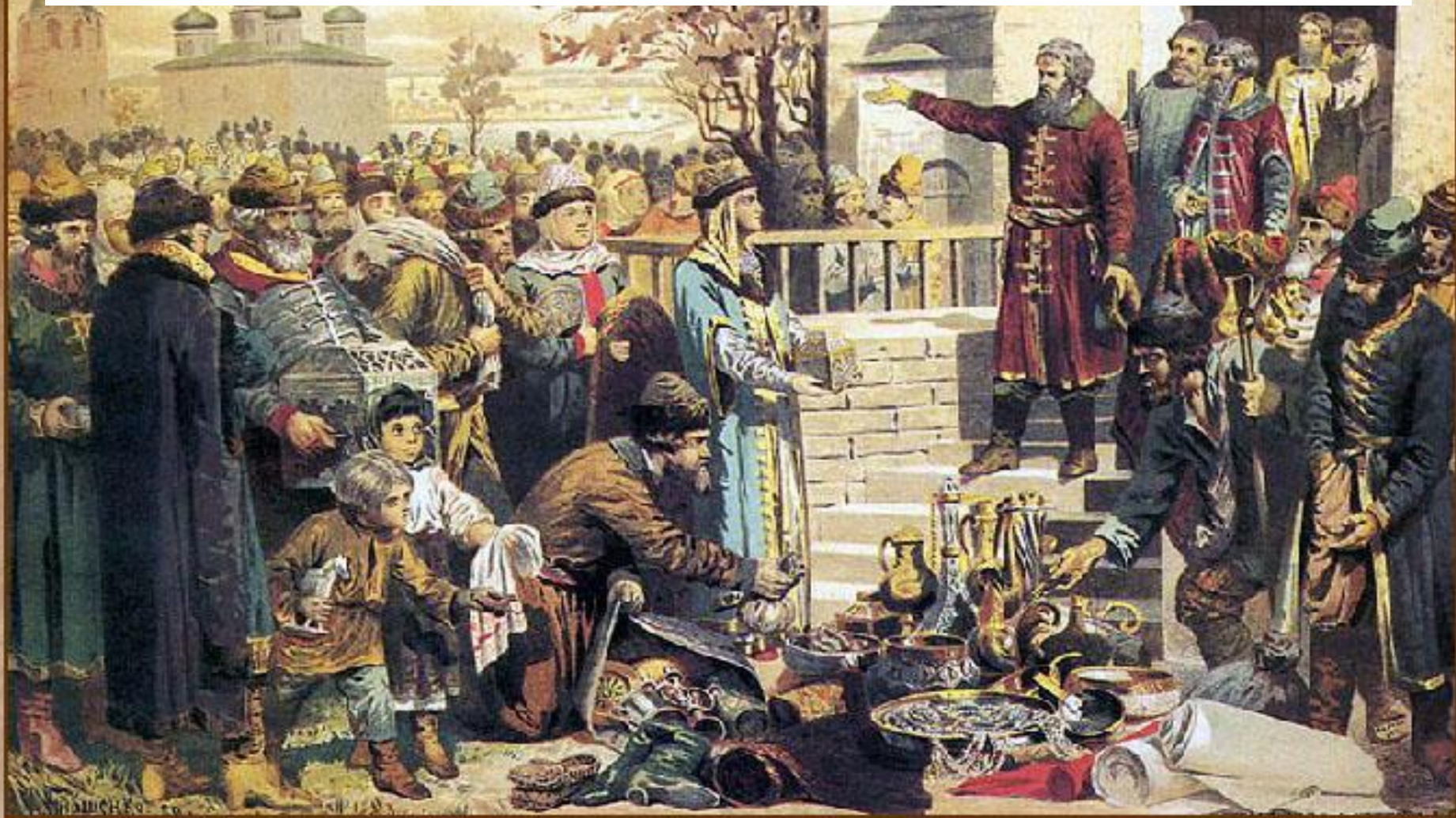
Воззвание Козьмы Минина к нижегородцам

Осенью 1611 г. по призыву нижегородского купеческого старосты К. Минина началось формирование народного ополчения.