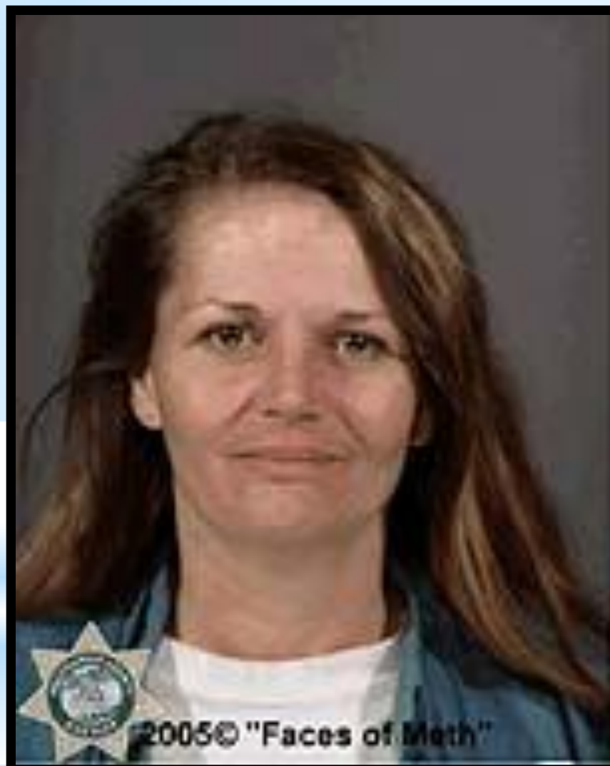
2005 © "Faces of Meth"