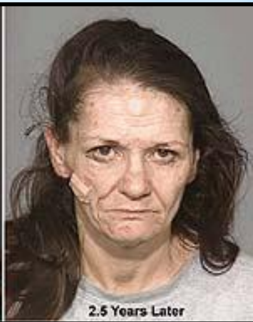
2.5 Years Later