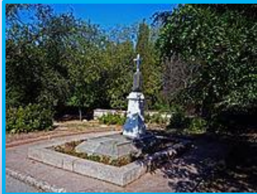
Монумент павшим при обороне Севастополя