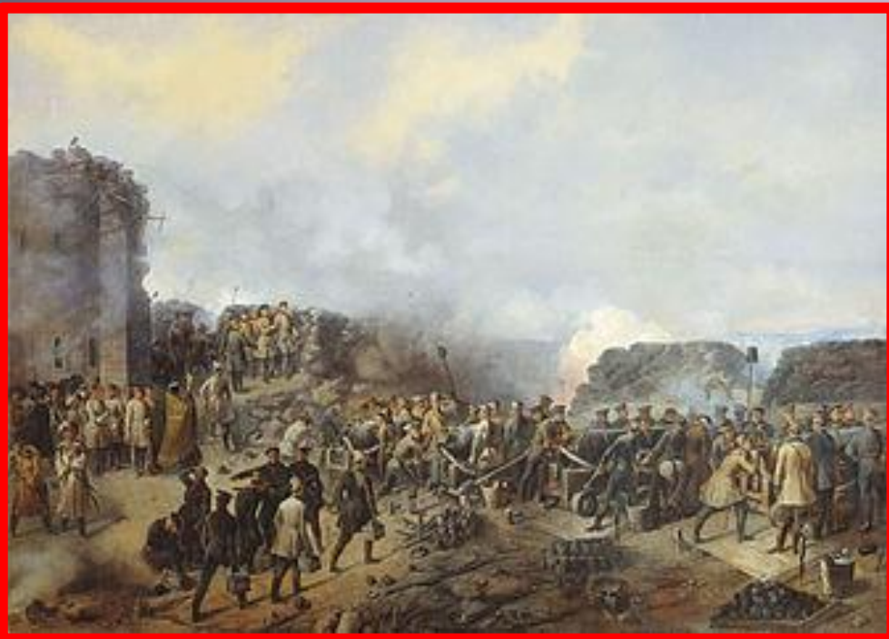
Бой на Малаховом кургане